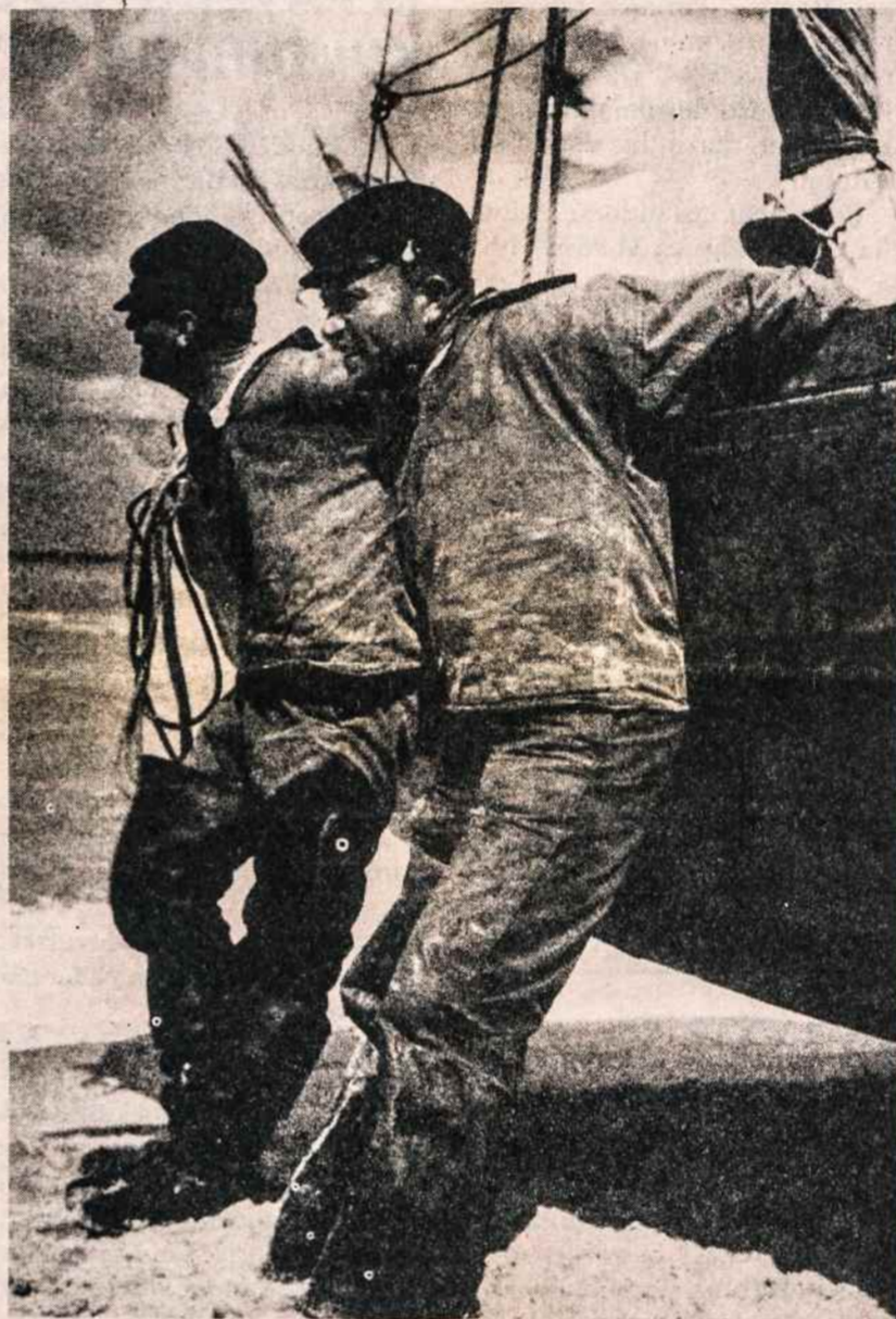
Kuršių marių žvejai

Po pernai gerai pavykusios ekskursijos į Europą šiais metais vėl organizuojame naują ekskursiją į Egiptą, Šventąją Žemę ir Graikiją. Išvykstame iš Chicago ir New Yorko balandžio 24, o grįžtame gegužės 11. Kelionė, įskaitant viešbučius ir maistą, iš Chicago kainuos apie 2300 dol., o iš New Yorko, be abejo, atitinkamai mažiau. Šioje kelionėje aplankysime gal pačias įdomiausias pasaulio vietas. Dėl smulkesnių informacijų galima kreiptis į "Laiškus lietuviams", 2345 W. 56th St., Chicago, Ill. 60636, arba tiesiog į kelionių biurą: American Travel Service Bureau, 9727 S. Western Ave., Chicago, Ill. 60643. Tik paskubėkite, nes laiko jau ne taip daug liko.