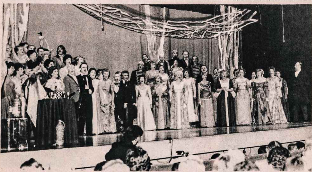
Čičinsko operos I veiksmo scena (Čičinsko dvare). Dainavos ansamblis gastroliuoja Clevelande, pakviestas LB Clevelando apylinkės.