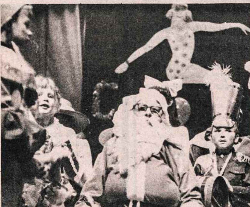
Kalėdų senis Maironio liuanistinėje mokykloje gruodžio 21 Kultūros Židinyje.

Visos šios ir kitos lietuviškos knygos bei lietuviškos plokštelės gaunamos Darbininko administracijoj: 341 Highland Blvd., Brooklyn, N.Y. 11207.