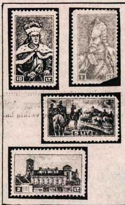
Nepriklausomybės pradžioje išleisti įvairūs aukų ženklukai.

Tai reiškia, kad Amerikos lietuviai buvo labai jautrūs savo