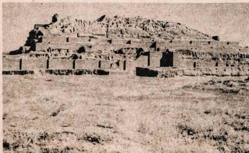
Elamas. Čoga Zambil — kalnas į dievybę.

Nykį dykynė tampa derlingais laukais. Įmantriai laistomi. Cukrašvendrės ir cukriniai runkeliai stiebtie stiebtieji aukštyn. Anksytvi žemdirbiai jau miklinasi