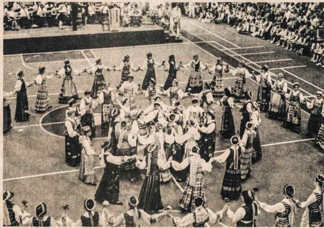
Rytinio pakraščio tautinių šokių šventėj mergaitės šoka Sadutę.

— Lietuvos Fondas, įvertindamas didžiules pastangas paruošti ir išleisti 6 tomų serijinį veikalą "Lietuvos bažnyčios", II tomo — "Vilkaviškio vyskupijos" išlaidom sumažinti paskyrė 1000 dol. subsidiją.