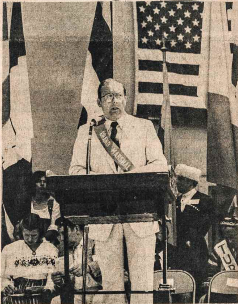
Senatorius Al D'Amato Pavergtų Tautų savaitės minėjime pasakė aiškią kalbą, remiančią prezidento Reagano apsiginklavimo programą ir pasipriešinimą komunizmui.