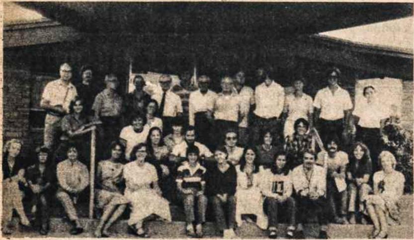
VII lituanistikos seminaro lektoriai ir studentai 1980 m. vasarą.