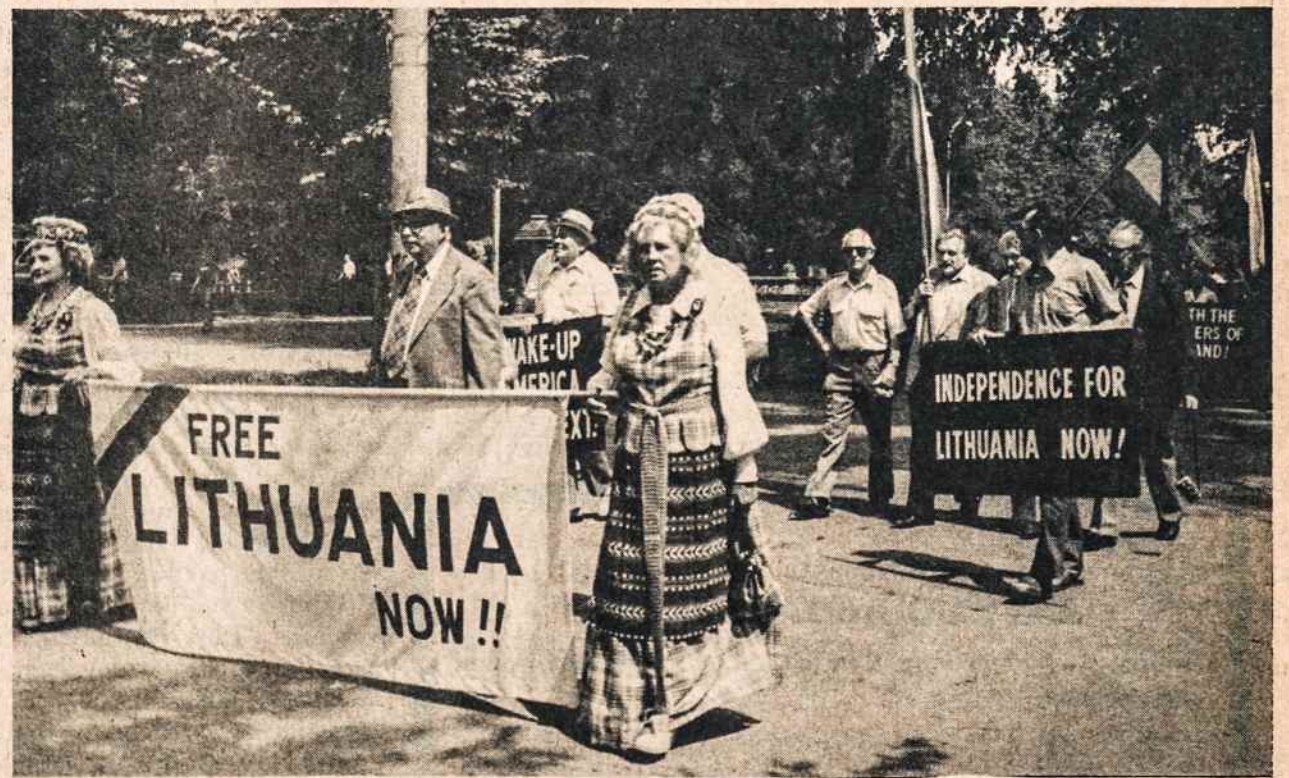
Pavergtų Tautų Savaitės parade dalis lietuvių su savo plakatais.

MŪNĖ — Dr. M. Siemoneit, lietuvis, draudžia sveikatą, nedirbimą, pensijas, gyvybę. (N.Y., N.J. ir Conn.) Apsidrausdami pas jį, sutaupysit 30%-50% premijos mokėjimą. Draudimo įvairios grupės, kurias galite pasirinkti. Skambinti dieną: 201 964-3500. Vak., savaitgaliais: 201 654-3756.