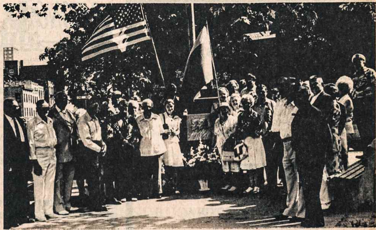
Dalis publikos Dariaus-Girėno minėjime liepos 18 Lituanikos aikštėje. Brooklyne.