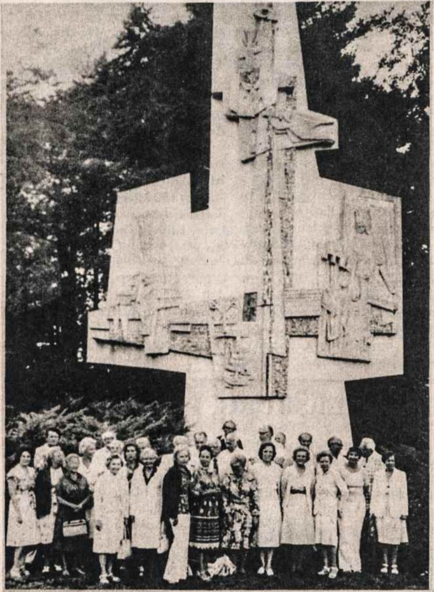
Dalis ateitininkų sendraugių stovyklos dalyvių Kennebunkporte, Maine, rugpiūčio 21.