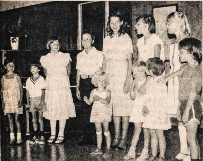
XV mokytojų studijų savaitės jaunieji dalyviai dainuoja naujai išmoktas dainas vakarinės programos metu Dainavoje.