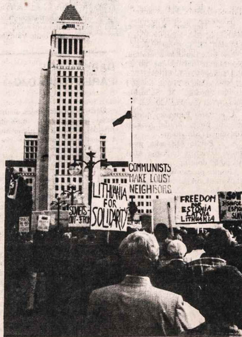
Los Angeles baltai žygiuoja paremti lenkų demonstracijų. Priekyje prie miesto rotušės plevėsuoja Lenkijos vėliava.