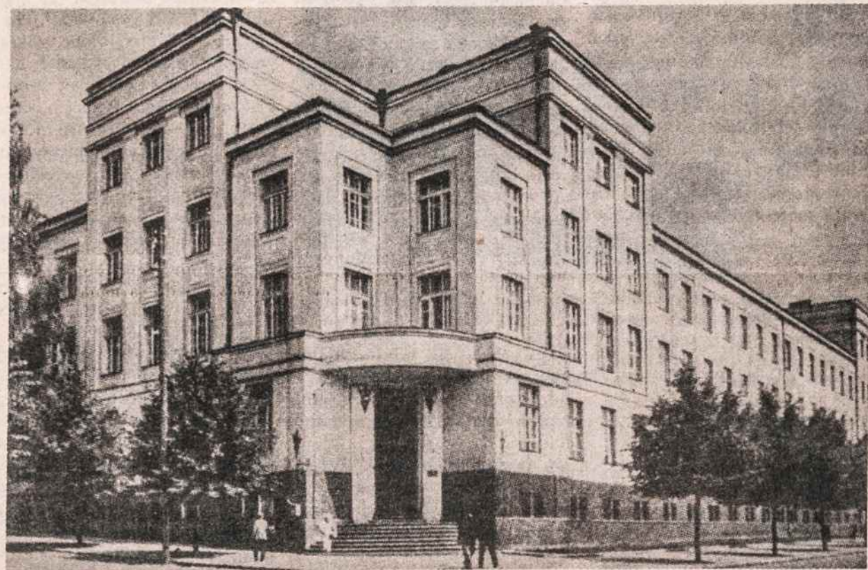
Vytauto Didžiojo Universiteto Kaune didieji rūmai. Dešinėje apačioje buvo universiteto biblioteka, pirmame aukšte gamtos muziejus, antrame aukšte Humanitarinių mokslų fakultetas, trečiame aukšte — Teologijos-Filosofijos fakulteto filosofijos skyrius, dešinėje — rektorius kambariai, dekanų kambariai, centrinė universiteto raštinė, universiteto paštas.

Valentino dienos išvakarėse, vasario 13, šeštadienį, 8 val. vak. Lietuvių Jaunimo Sąjungos Baltimore skyrius Lietuvių namuose rengia šokius su užkandžiais. Įėjimo auka 3 dol. Pusė viso pelno bus paskirta Lietuvos atstovybės pastato Washington remontui. Miela, kad jaunimas reaguoja į lietuviškus reikalus.