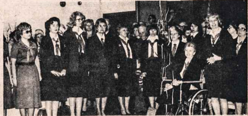
Clevelando skautininkės Kaziuko mugėje.