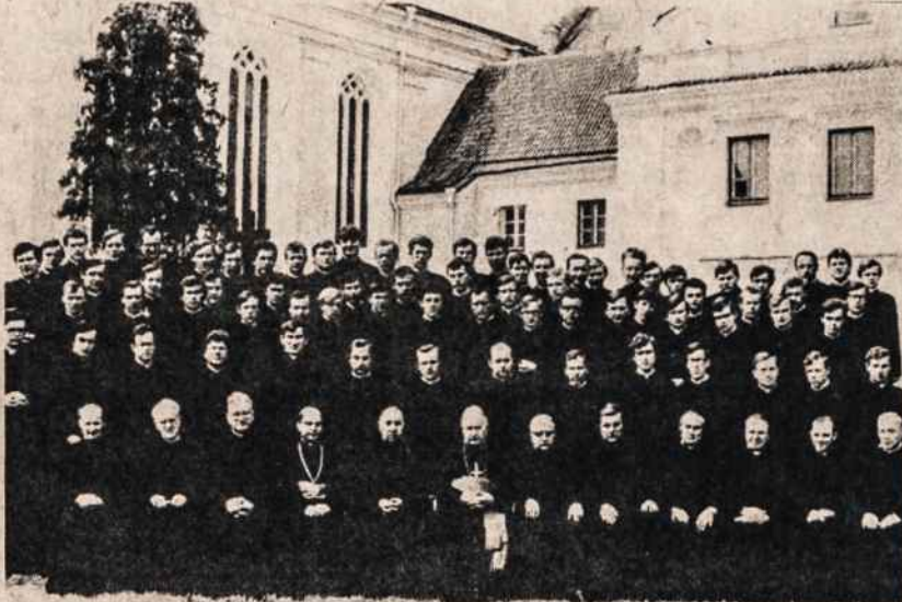
Kauno kunigų seminarija 1980-81 metais. Pirmoje eilėje sėdi profesūra. Klierikų yra apie 90. Koks tai mažas skaičius, nes seminarija yra visai Lietuvai.