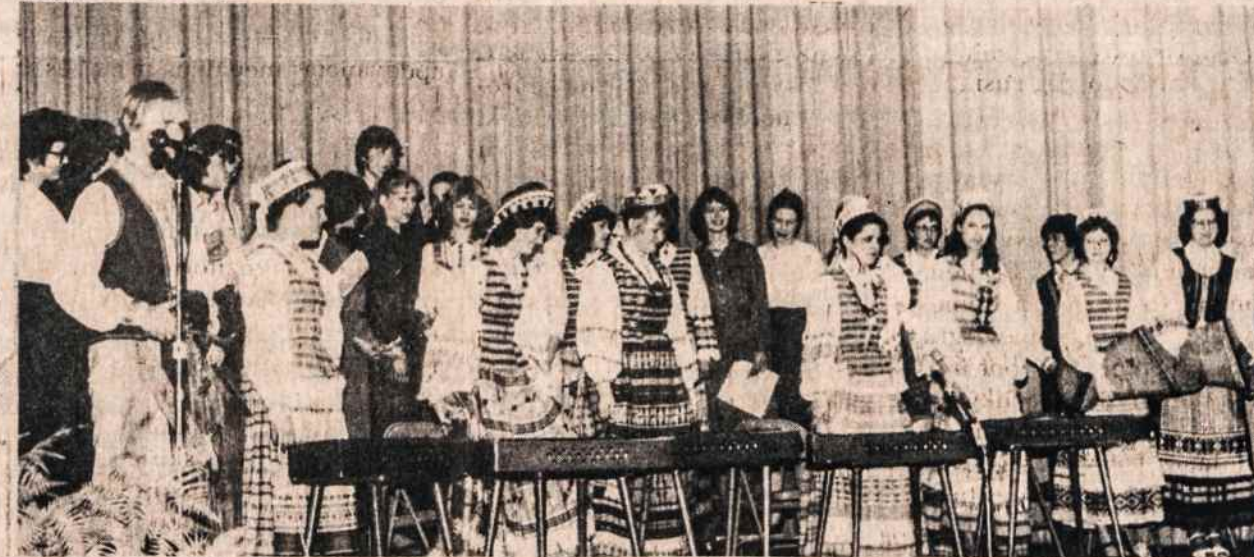
Clevelando Šv. Kazimiero lituanistinės mokyklos 25 metų sukakties minėjime mokyklos choras atliko dalį programos.