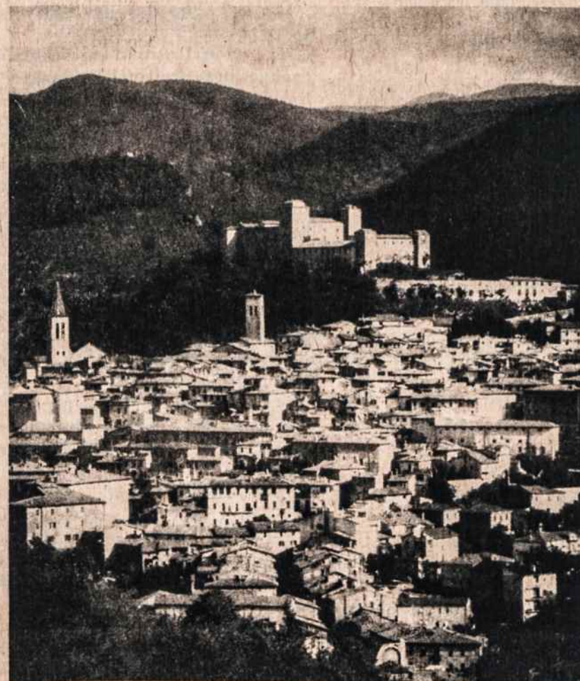
Spoleto miestas ir pilis, kur Pranciškus buvo įspėtas, kad pasirinkęs ne tą valdovą.