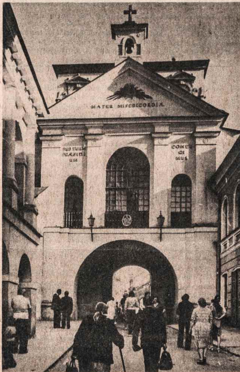
Aušros Vartai Vilniuje. Viršuje už didžiojo lango yra altorius su Dievo Motinos paveikslu. Viršuje įrašyta lotyniškai—Motina Gailestingumo, Tavo pagalbos šaukiamės. Nuotrauka daryta prieš porą metų Vilniuje.