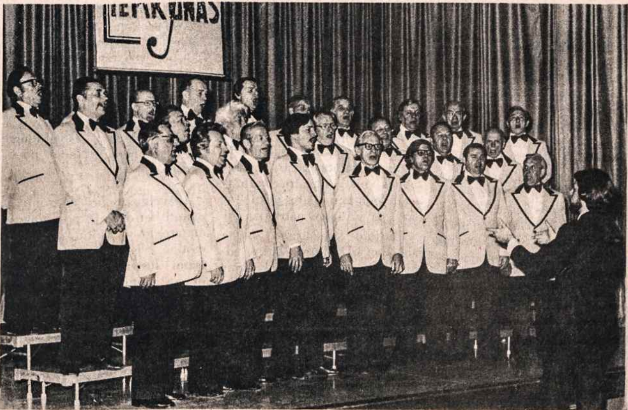
New Yorko vyrų choras Perkūnas 1980 metų koncerte. Šiomet gegužės 22 choras vyksta koncertuoti į Worcester, Mass., kur Vinco Kudirkos šaulių kuopa mini savo veiklos 25 metų sukaktį.