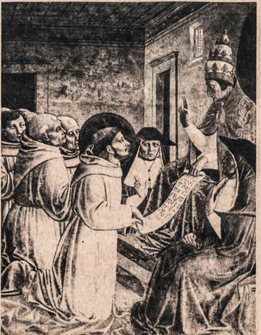
Šv. Pranciškaus regulos patvirtinimas. Dail. B. Gozzoli

Jis, sunkiai sirgdamas, sutiko priimti ir savo dvasios dukters šv. Klaros patarnavimą, nes norėjo pabūti ten, kur pirmą kartą j