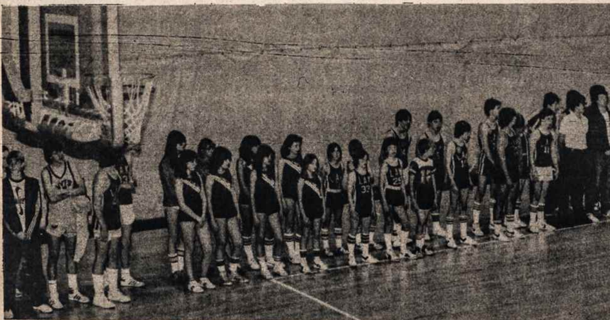
XXXII Šiaurės Amerikos lietuvių sporto žaidynės įvyko Clevelande gegužės 7 ir 8. Nuotraukoje — sporto šventės atidarymas. Vidury — New Yorko sporto komandos.