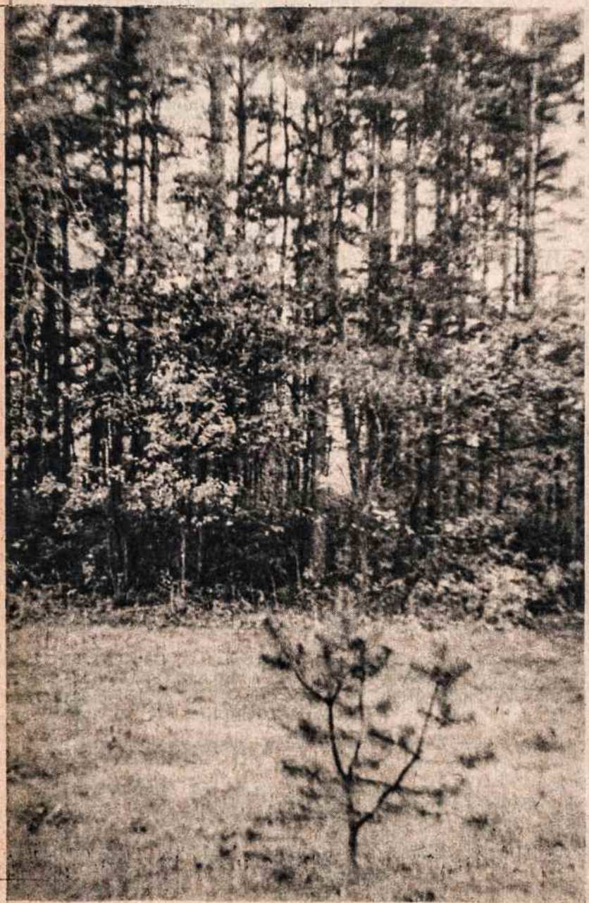
Jonaičių kaimo kapinės prie Lekėčių, Šakių apskrityje. Iki 1906 jose buvo laidojami žmonės.