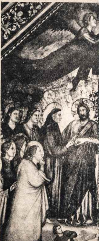
Šv. Pranciškaus sužieduotuvė paveikslas apatinėje šv. Pranc

Naujoms ligoms prisidėjus, neišvengiamai artinosi mirtis. Vieną dieną jis sveikatą tikri-