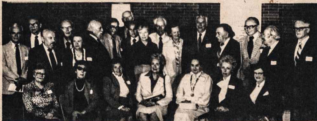
Lietuvių Rašytojų Draugijos suvažiavime dalis rašytojų su savo žmonom.