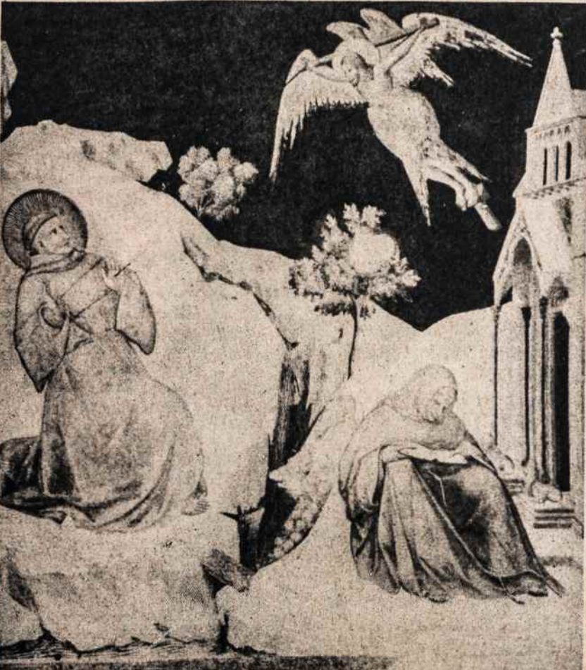
Šv. Pranciškaus žaizdų gavimas. Dail. P. Lorenzetti paveikslas apatinėje Šv. Pranciškaus bazilikoje

Reikėjo dar atsiveikinti ir pagerbti savo sužieduotinę Neturto Ponią, kuriai visą gyvenimą riteriškai buvo ištikimas. Kaip prieš 20 metų, visko išsižadėjęs nuo-