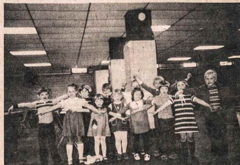
Maironio mokyklos darželio mokiniai dainuoja ir šoka "Stypu, stypu". Nuotr. Nijolės

Po langais pražydo Tulpės ir narcizai, Džiaugsmas mums prašvito Šį Velykų rytą.