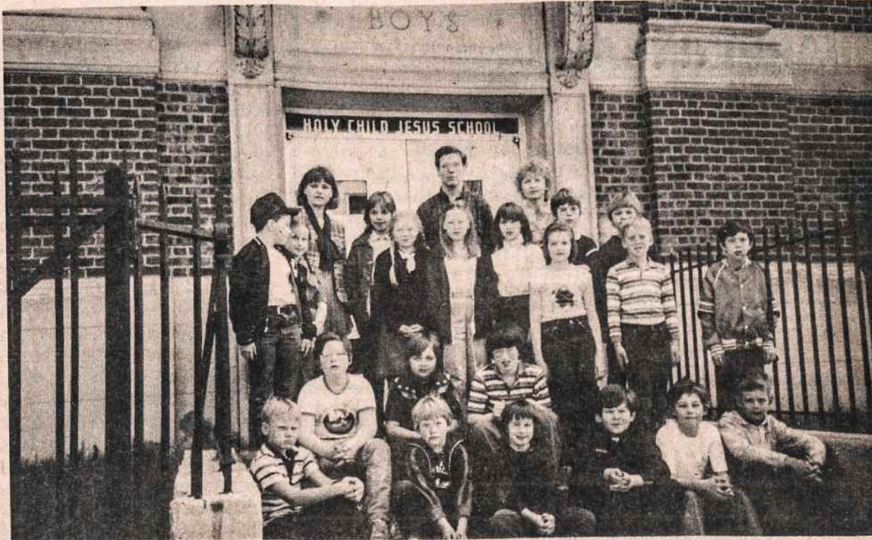
Antro, ketvirto ir penkto skyriaus mokiniai prie mokyklos laiptų. Gale stovi mokytojai G. Stankūnienė, A. Lukoševičius ir A. Vaičaitienė.