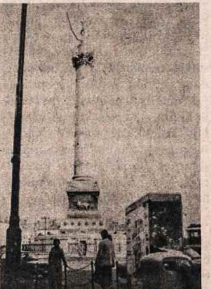
Prie Bastilijos paminklo Paryžiuje