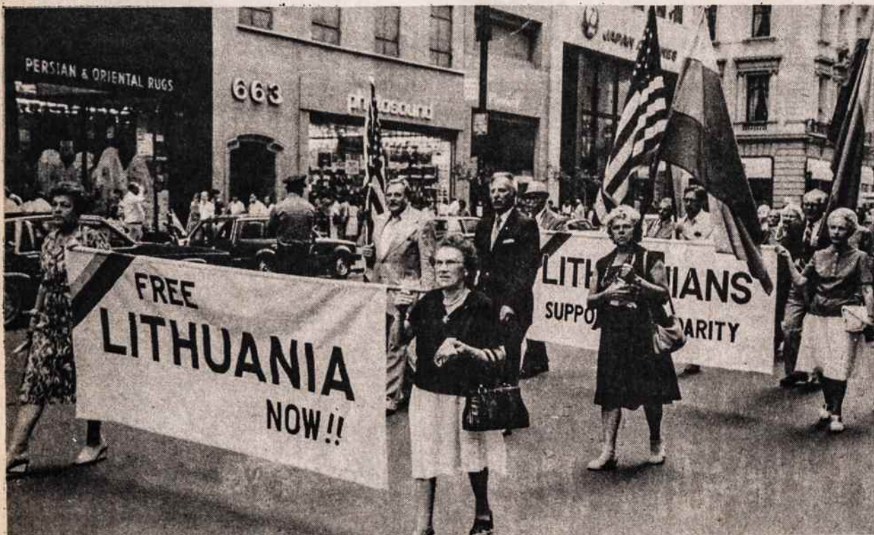
Dalis lietuvių pavergtųjų tautų parade liepos 11 žygiuoja Pentktąja Ave. į Centrinį Parką, kur vyko pagrindinis minėjimas.