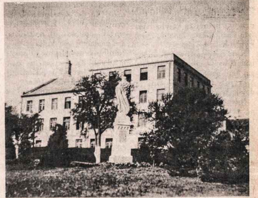
Telsių kunigų seminarija nepriklausomos Lietuvos laikais