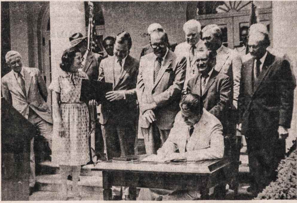
Baltųjų Rūmų rožių sodely JAV prez. R. Reagan liepos 19 pasirašė proklamaciją, skelbiančią liepos 19-25 Pavergtųjų Tautų savaitę Amerikoje. Stebi: prezidento asistentė Elizabeth Dole, viceprez. George Bush, kongresmanai Derwinski, Zablocki, senatorius Thurmond ir kiti. Į pasirašymo iškilmes buvo pakviesti pavergtų tautų atstovai, jų tarpe ir keletas lietuvių.

Kinija pradėjo vykdyti gyventojų surašymą.