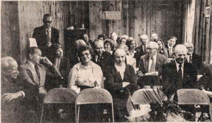
Connecticuto LB apygardos metinis suvažiavimas New Havene.

Visi indėliai apdrausti iki 100.000 dol.