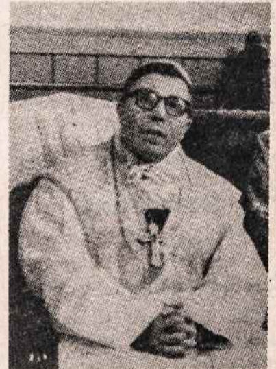
Vysk. Vincentas Sladkevičius, Kaišiadorių vyskupijos apaštališkasis administratorius.

Išsikūrė penki vyrų vienuolynai: trys pranciškonų, vienas marijonų ir vienas kapucinų. Trys vienuolijos iš viso turėjo apie 90 narių, iš kurių 22 buvo kunigai, 22 klierikai. Seselių vienuolių Telšių vyskupijoje 1940 metais buvo vienuolika. Jose iš viso buvo 46 seserys ir 16 novicijų. Katalikų skaičius prieš II pasaulinį karą buvo pasiekęs keturis šimtus tikstančių.