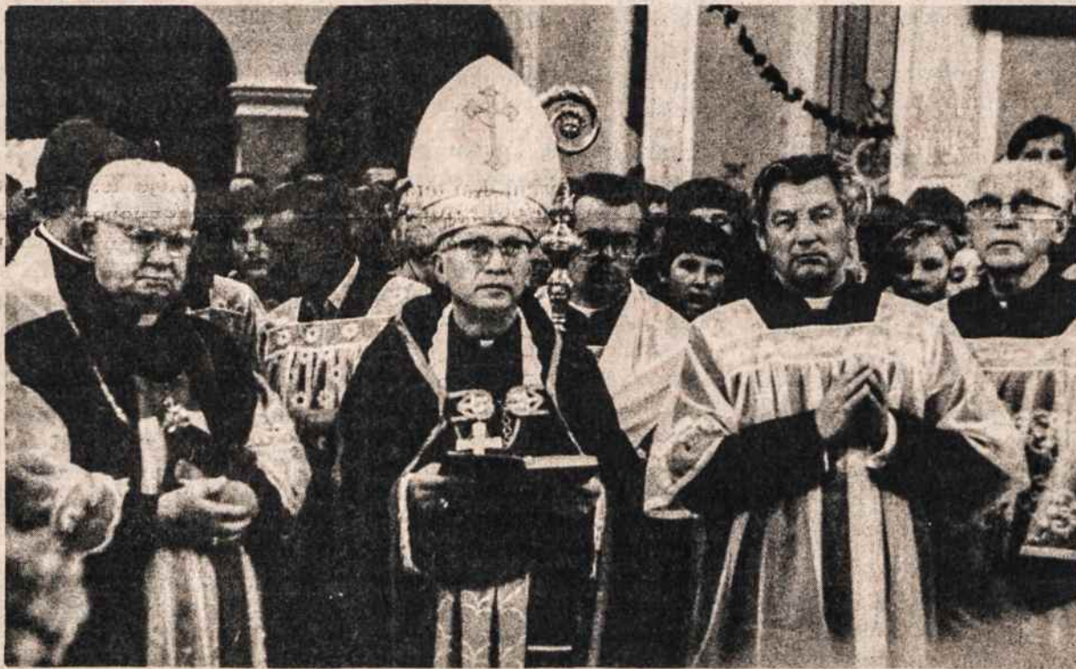
Naujasis Telšių vyskupas Antanas Vaičius 1982 rugpjūčio 14 lanko Kretingos bažnyčią.