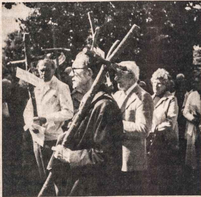
Auriesville kankinių šventovėje N.Y., rugpjūčio 29 buvo suvažiavę daug lietuvių maldininkų pasimelsti už kenčiančią Lietuvos Bažnyčią. Kryžiaus Kelius einant, buvo nešama 14 medinių kryžių, ant kurių buvo surašyta už LKB Kronikos platinimą nuteistųjų pavardės.