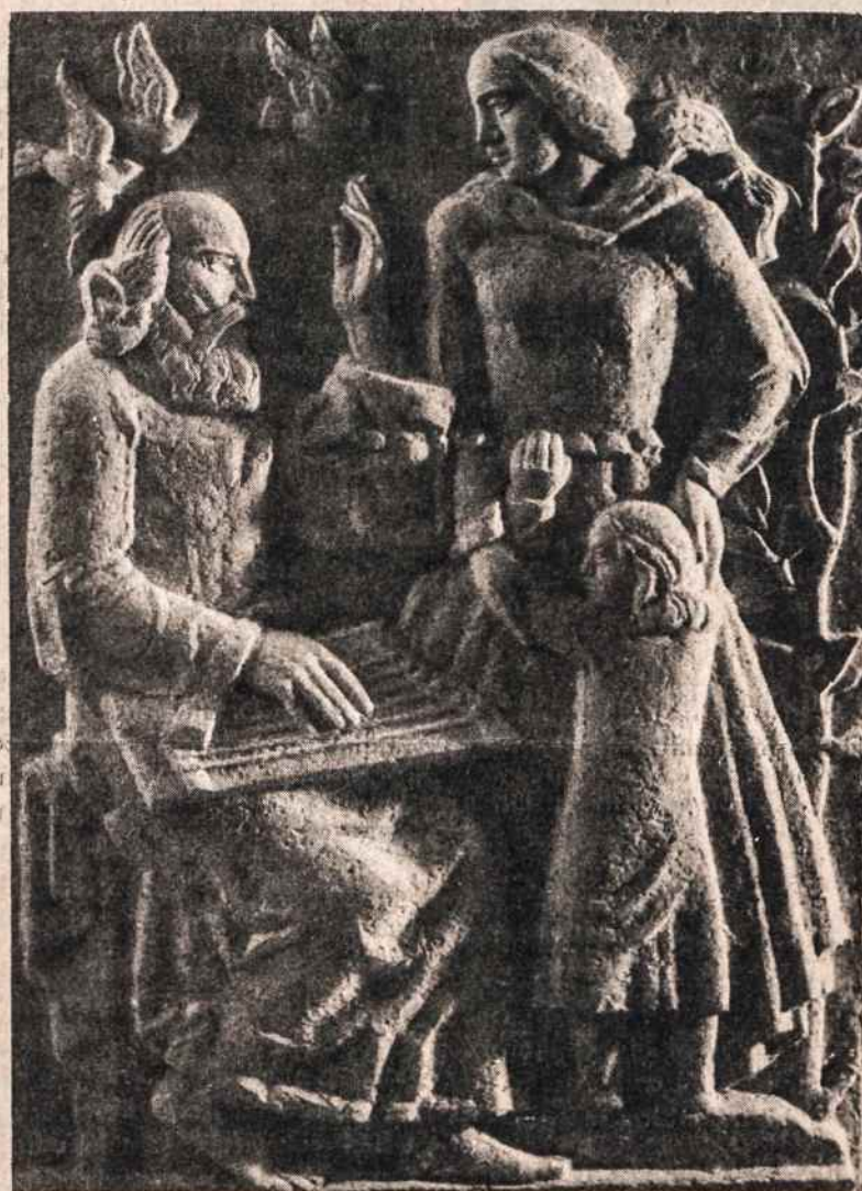
Senovės Lietuvos kanklininkas. Skulptorius Antanas Marčiulionis. Senas kanklininkas — vaidila, prisimena didelius tautos žygius, narsius vyrus — karžygius, kurie sukūrė Lietuvą. Jo klausos moteris su giliu dėmesiu giesmei ir praeičiai. Vaikutis net išsiganę klausosi senovės giesmės. Jam ji atrodo tokia didinga ir galinga.