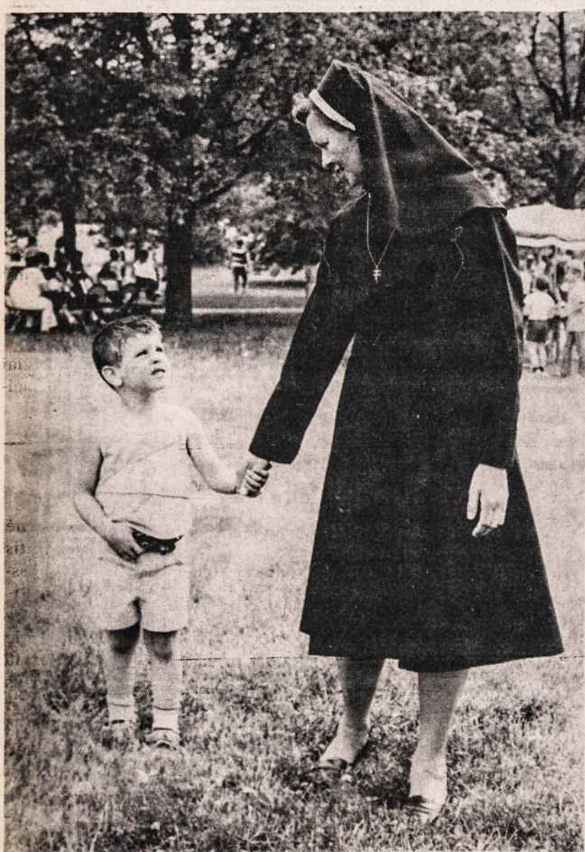
Sesuo Paulina metinėje šventėje Brocktone, Mass., su "svečiu".