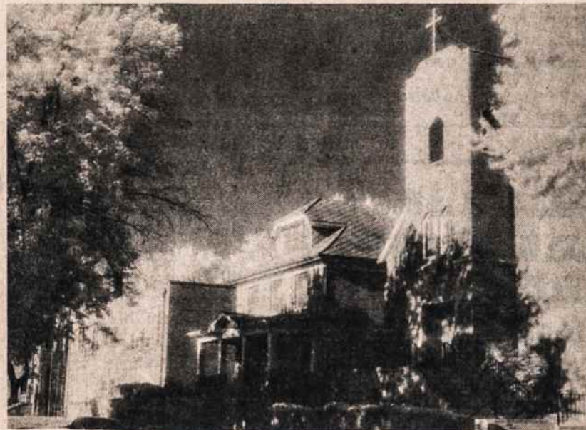
Omahos lietuvių Šv. Antano parapijos bažnyčia, senoji klebonija ir buvusi mokykla.