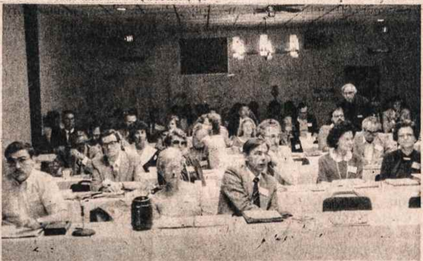
JAV LB X-tos Tarybos pirmosios sesijos dalyviai posėdžiauja St. Petersburg, Fla.