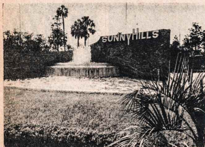
Sunny Hills įvažiavimas