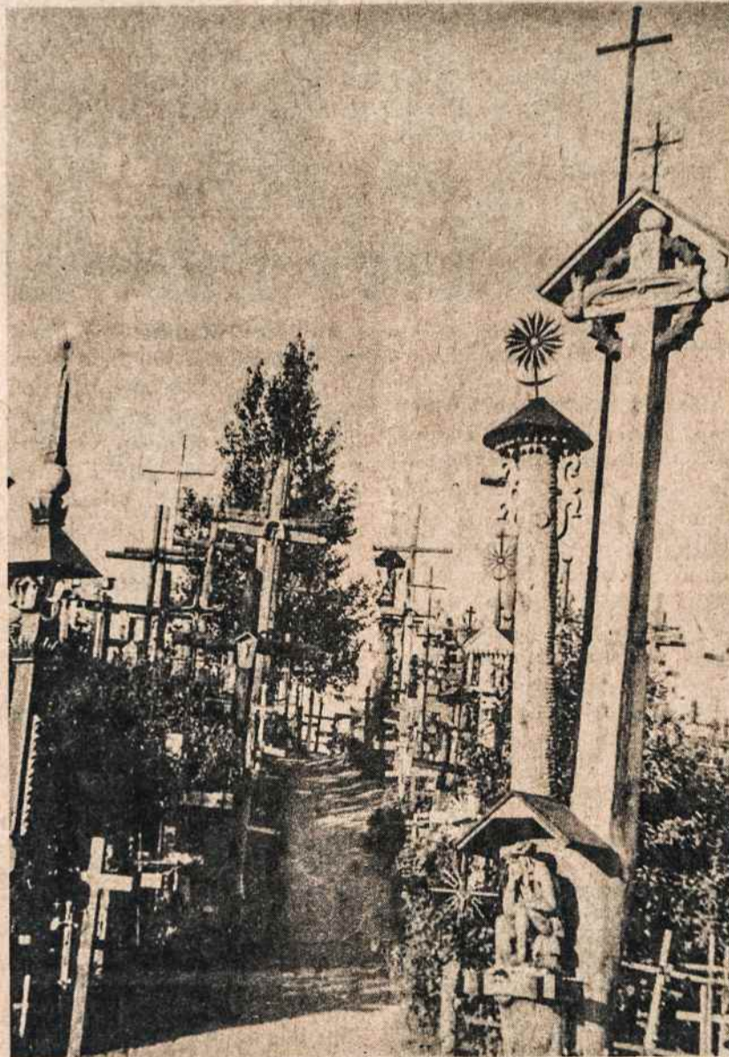
Kryžių kalnas 1982 metais. Vienas keliautojas taip rašė apie Kryžių kalną: "Didžiausią įspūdį padarė apsilankymas Kryžių kalne. Jis tiesiog pražydęs kryžiais. Ant kalno teko būti kažkada anksčiau, tačiau tokios daugybės kryžių tada nebuvo. Pačiame kalno viršuje yra dvi Šv. Marijos statulos."