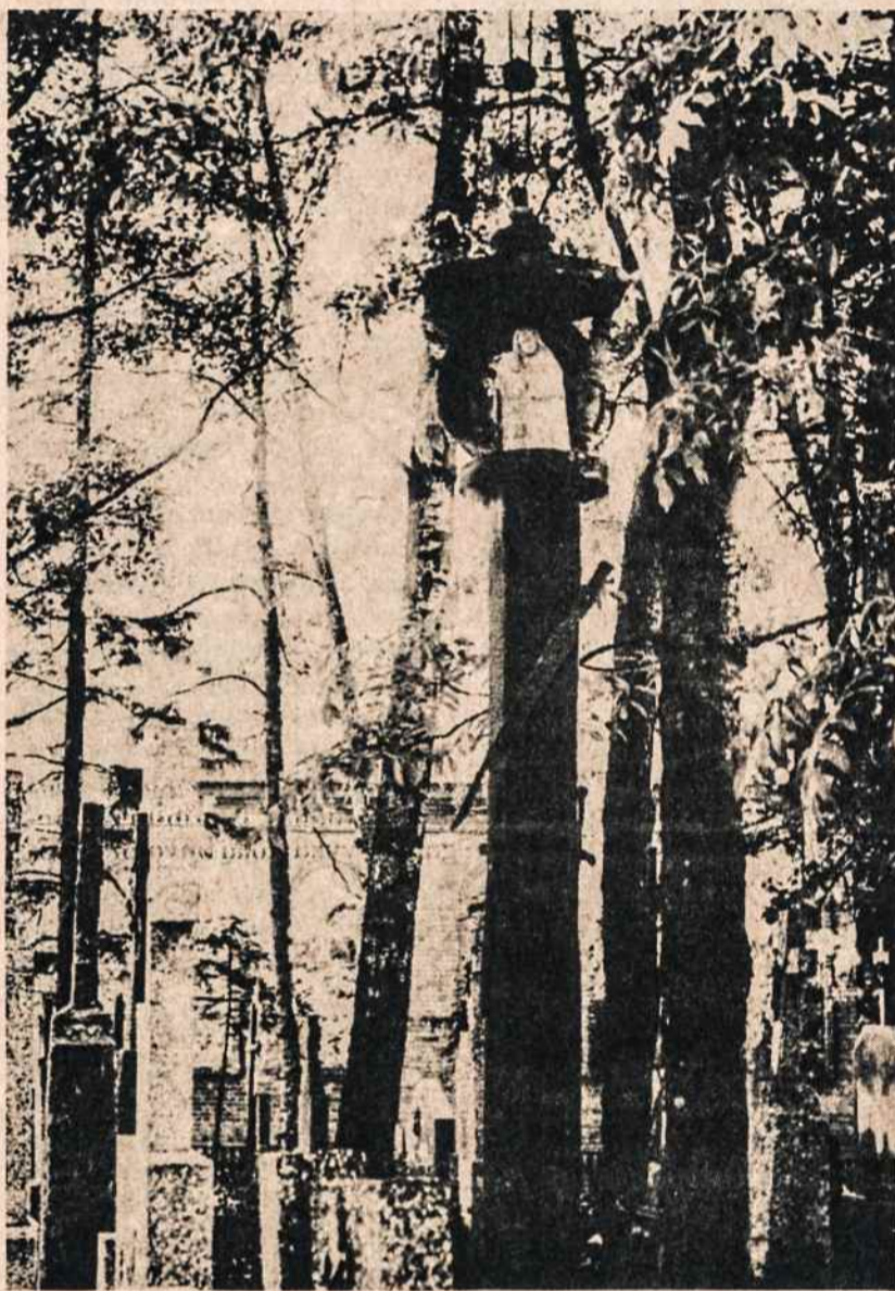
Kryžius 1863 metų sukilimui ir jo aukom prisiminti, pastatytas Sūkų parapijos kapinėse, Šakių apskrityje. Kryžiaus viename šone yra dalgis ir 1863 m. - 1864 m., antrame šone — kardas ir 1863 m. - 1963 m., trečiame šone — durtuvas ir 1863 m. - 1963 m.

Įdomus gerai iliustruotas reportažas "Lietuviai Australijoje". Iš jo nemažai sužinome apie Australijos lietuvių veiklą aplamai ir apie jų rengiamas, kas antri metai įvykstančias Lietuvių dienas. Kai ši apžvalgė rašoma (1982 gale) Australijos Lietuvių dienos kaip tik vyksta Melbourn miesto. Girtina, kad