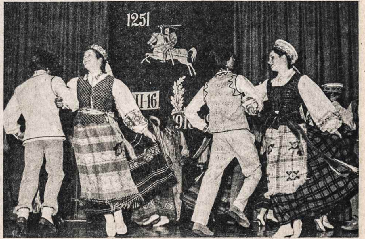
Kultūros Židinio scenoje šoka New Yorko tautinių šokių ansamblis Tryptinis, minint Lietuvos nepriklausomybės šventę.

Tikimės greit Jus išgirsti! KASOS direktorių taryba