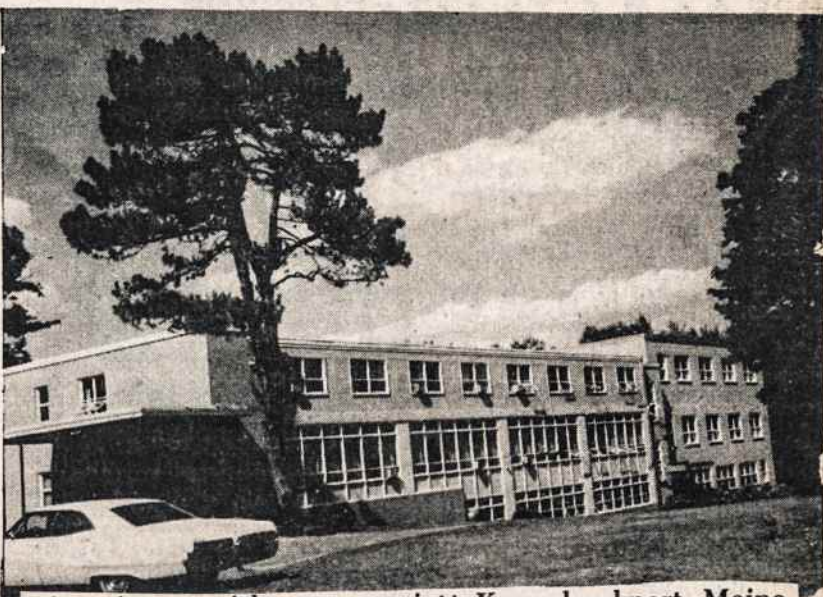
Lietuvių pranciškonų vasarvietė Kennebunkport, Maine, laukia vasarotojų.

Metinė pabaltiečių dailės paroda atidaryta kovo 5 Latvių namuose Bronx. Oficialus parodos atidarymas įvyko kovo 6, sekmadienį. Atidarymo metu latvių išraiškos šokių šokėja Vija Vētra apžvelgė šokių vystymąsi, pradėdant primityvių tau-