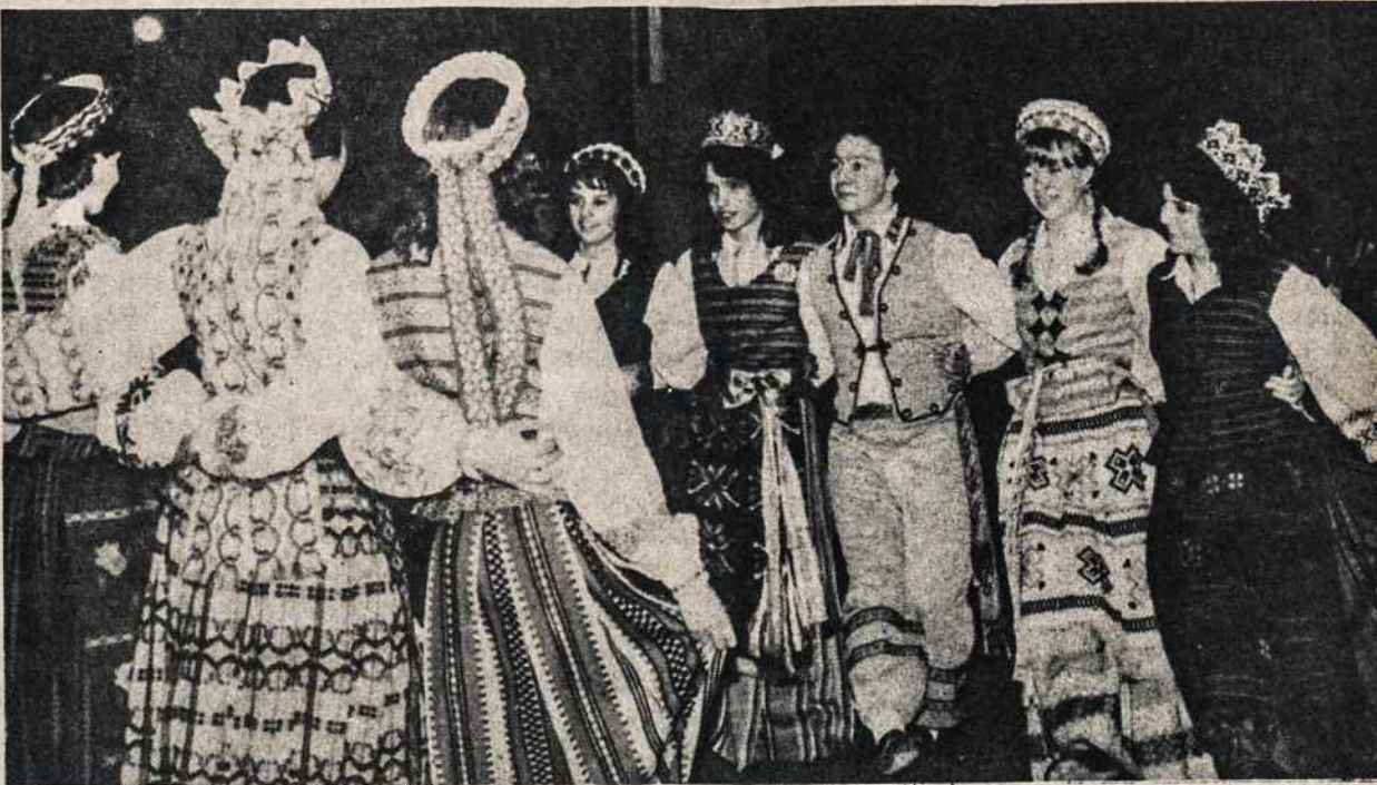
Hartfordo Berželio tautinių šokių grupė šoka zanavykų aplinkinį savo metiniame koncerte vasario 5.