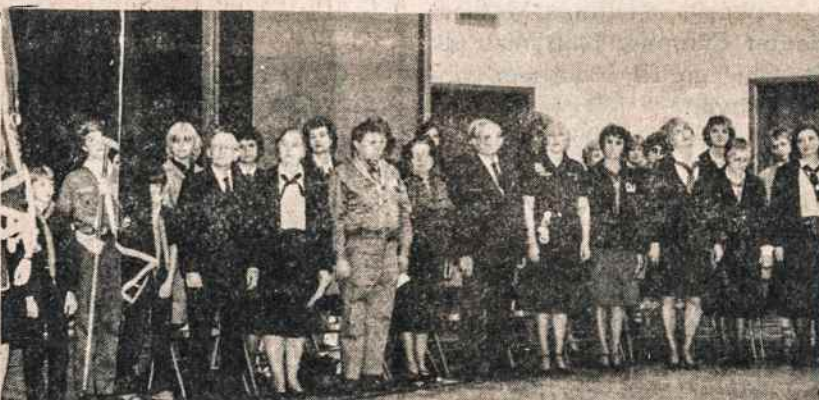
Clevelando skaučių Neringos tunto šventėje vasario 20 vėlavos šventinimo dalyviai.

Pirmuose keliuose puslapiuose (įvadinėse pastabose, atskleidamas moterį kaip seserį ir kaip smurto auką, liedamas Kristaus palyginimus) K. Trimakas paruošia kelią į rimtą religinį nuoseikimą. Skyrely "Mąstymas" išnagrinėja visą G. Remeikytės eilėraštį, atskirai imdamas po vieną sakinį. Mąstymą užbaigia skyreliu "Kristus moters vietoj, moteris Kristaus vietoj", dar paryskindamas moters reikšmę.