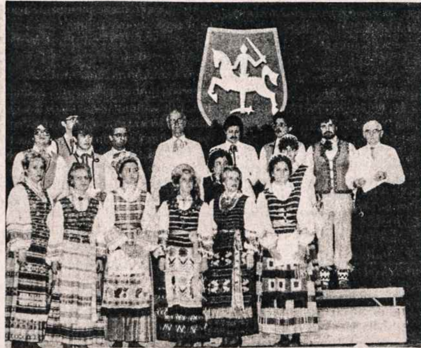
Philadelphijos Vilties choras, atidarant Vasario 16-tosios minėjimą Lietuvių klube Philadelphijoje.

Visi statykime Lietuvių Fondą, nes gautomis palūkanomis remiamas lietuviškos išlaidų klymas.