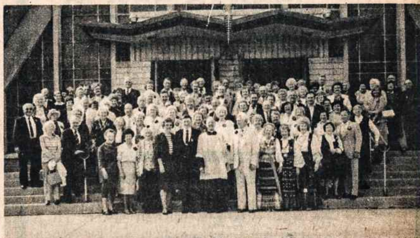
Vid. Atlanto Lietuvos vyčių suvažiavimo dalyviai birželio 5 prie Maspetho V. Atsimainymo bažnyčios.

QUEENS COLLISION CENTER INC. Expert auto body works — Ducco painting — Welding — Frames straightened — Fiber glass work. John R. Chicovich, 131-13 Hillside Avenue, Richmond Hill, N.Y. 11418. 24 hr. towing phone HI 1-6666. Towing after 6:00 — 843-6677.