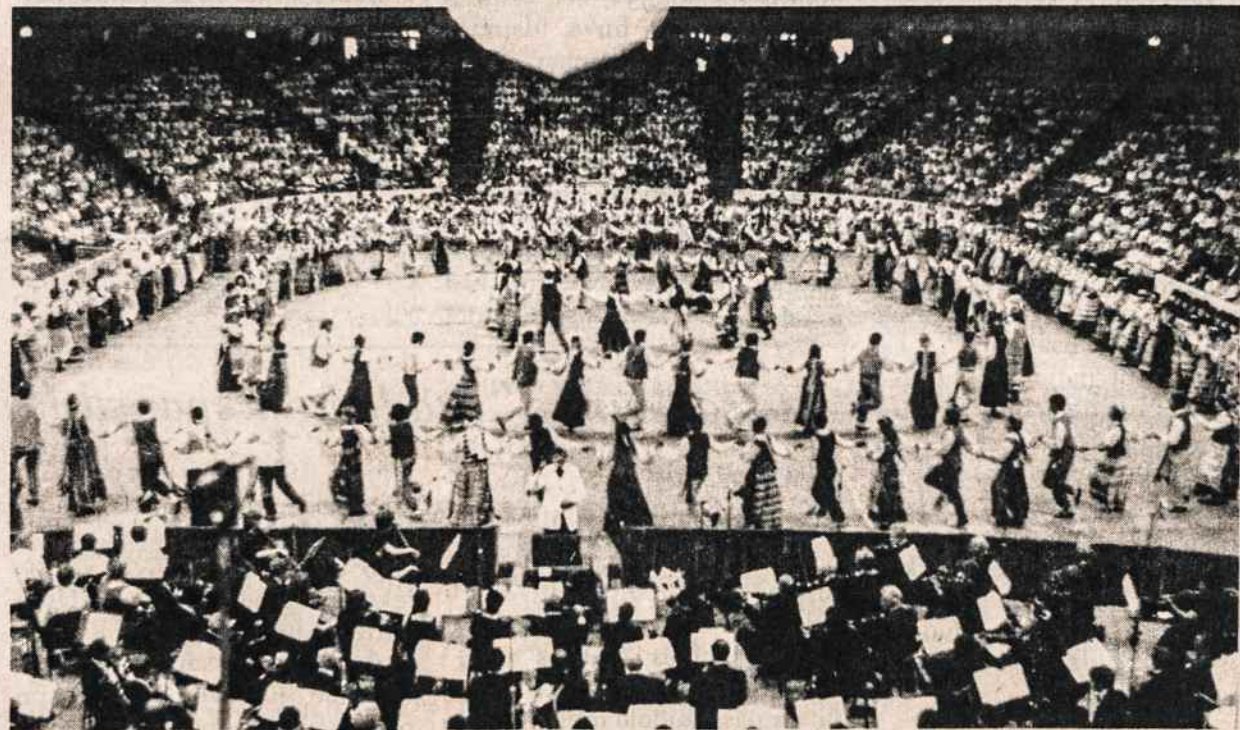
Dainų šventėj liepos 3 Chicagoj jungtinė tautinių šokių grupė šoka Kalvelį.

1. Darbo būrelio vardas (taigi tema): Dvikalbiškumas — puoselėti ar ne? Vieta: OC 5 (at-spėkite, kurioj planetoj? Bet aš