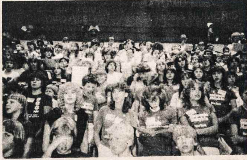
Dainų šventės repeticijų metu jaunių choro altai. Vidury maža grupė Maironio mokyklos dalyvių.