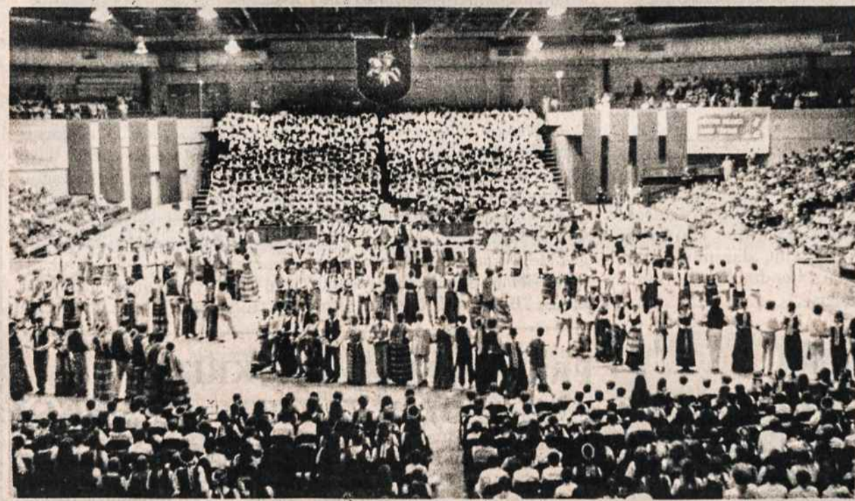
Dainų šventės uždaryme jungtinė tautinių šokių grupė šoka Subatėlė.