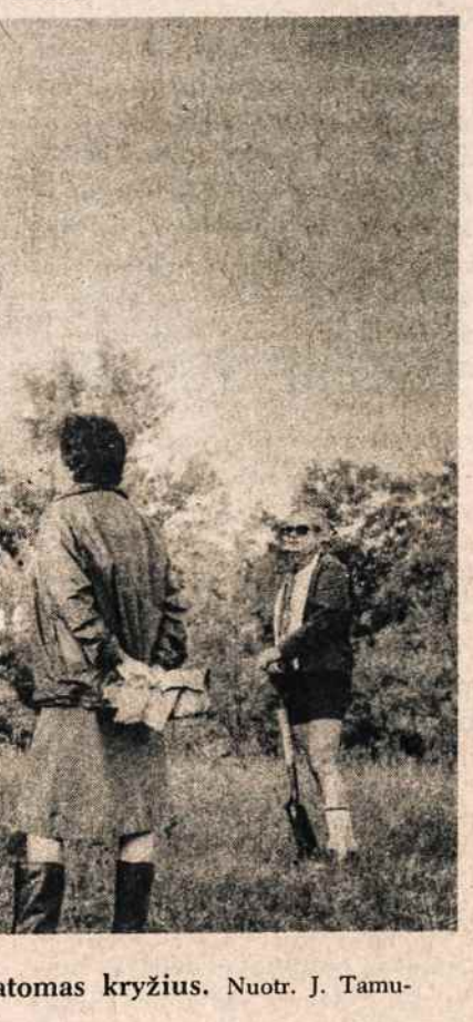
Lietuvių Skautų Sąjungos jubiliejinė stovyklą Kanadoj statomas kryžius.

Be to, primena profesorius Oleszczuk, apie Lietuvos disidentinį sąjūdį užsienyje pasirodo vis daugiau teorinės literatūros. O, galiausiai, Lietuvos atvejį galima panaudoti kaip įdomų pagrindą palyginimui su kitomis grupėmis Sovietų Sąjungoje ir visame pasaulyje, nes Lietuvos disidentinio sąjūdžio reikalavimai apima nacionalizmą, religijos, laisvės, kalbos ir žmogaus teisių gynimą. Į tuos reikalavimus režimas atsako visom diktatūrom būdingomis prievartos priemonėmis. Ir taip formuojasi "užburta ratas" — disidentizmas iššaukia prievartą, o prievarta skatina tolesnį disidentizmą.