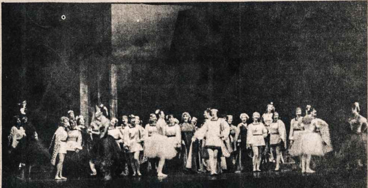
I Lituani operos pastatyme Chicagoje. Nuotr. V. Bacevičiaus