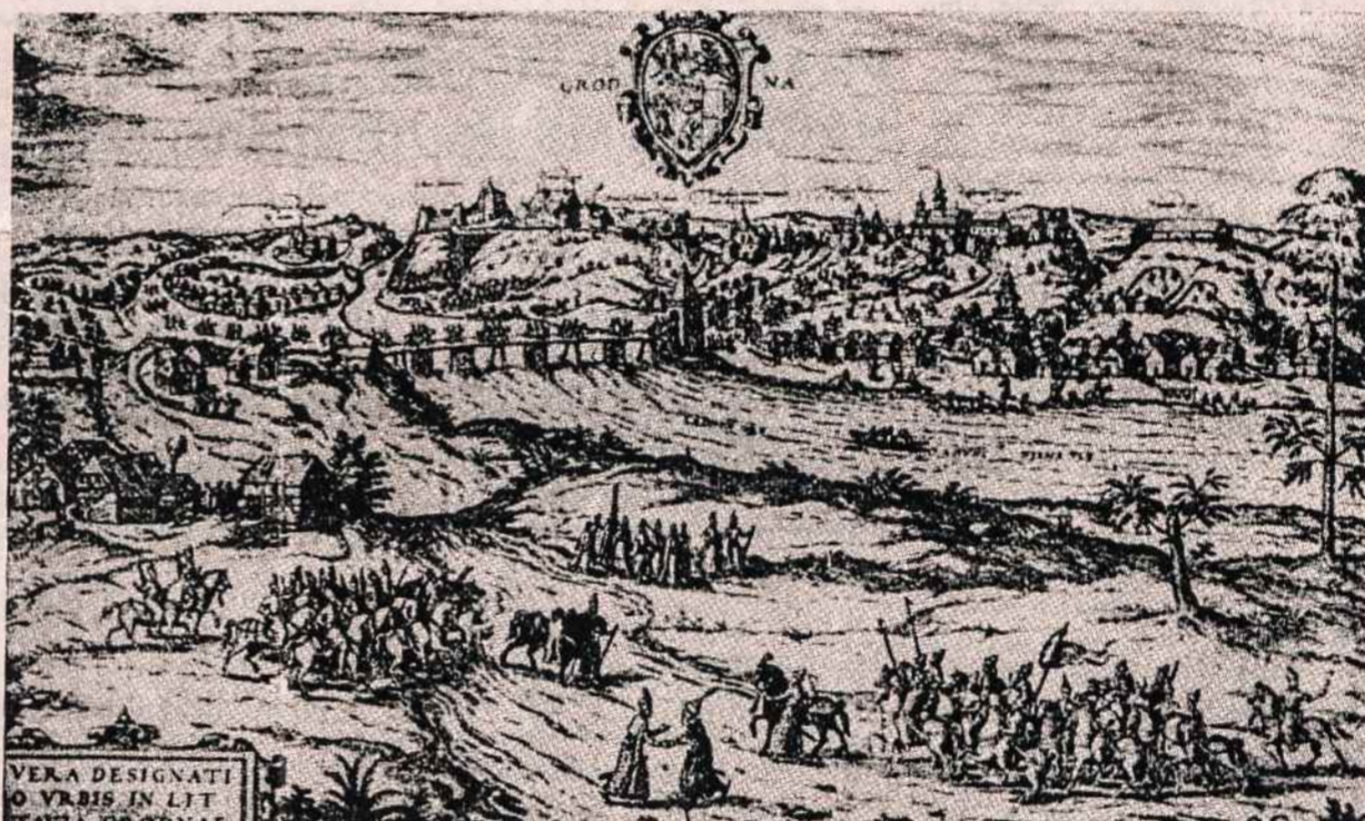
Gardinas 16 amžiuje. Gardine 1484 kovo 4 mirė šv. Kazimieras. Palaidoti buvo nuvežtas į Vilnių. Kitais metais švenčiama 500 sukaktis nuo jo mirties.

"Kovo Ketvirtosios" romanui išleisti vėjus vėliava iškelta! Paremkit, padėkit — šventasis Karaliaučis tebegyvas mūsų tarpe!