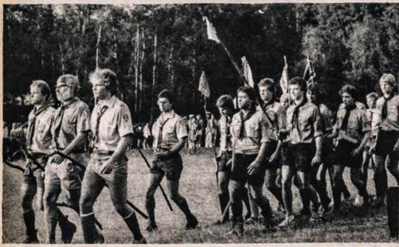
Paradas skautų jubiliejineje stovkykloje.

VYTIS INTERNATIONAL TRAVEL SERVICE 2129 KNAPP STREET BROOKLYN, N.Y. 11229 TEL.: (212) 769-3300