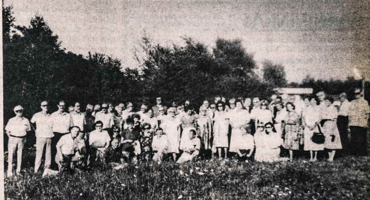
Liet. Fronto Bičiulių studijų ir poilsio savaitė Dainavoje.

Europoje į šitą Amerikos užsirašymą buvo atkreiptas didesnis dėmesys negu Amerikoje, net pačioje lietuvių spaudoje. Apie tai rašė Vokietijos, Švedijos, Šveicarijos, Austrijos, Italijos laikraščiai, kai kur pranešinėjo radijo ir televizijos stotys. Štai charakteringos antraštės vokiečių kalba spaudoje: