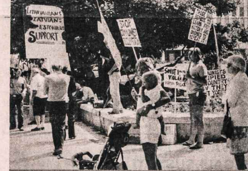
Protestuojant prieš Korėjos lėktuvo numušimą ir 269 keleivių nužudymą, keliamas ir Baltijos valstybių klausimas.