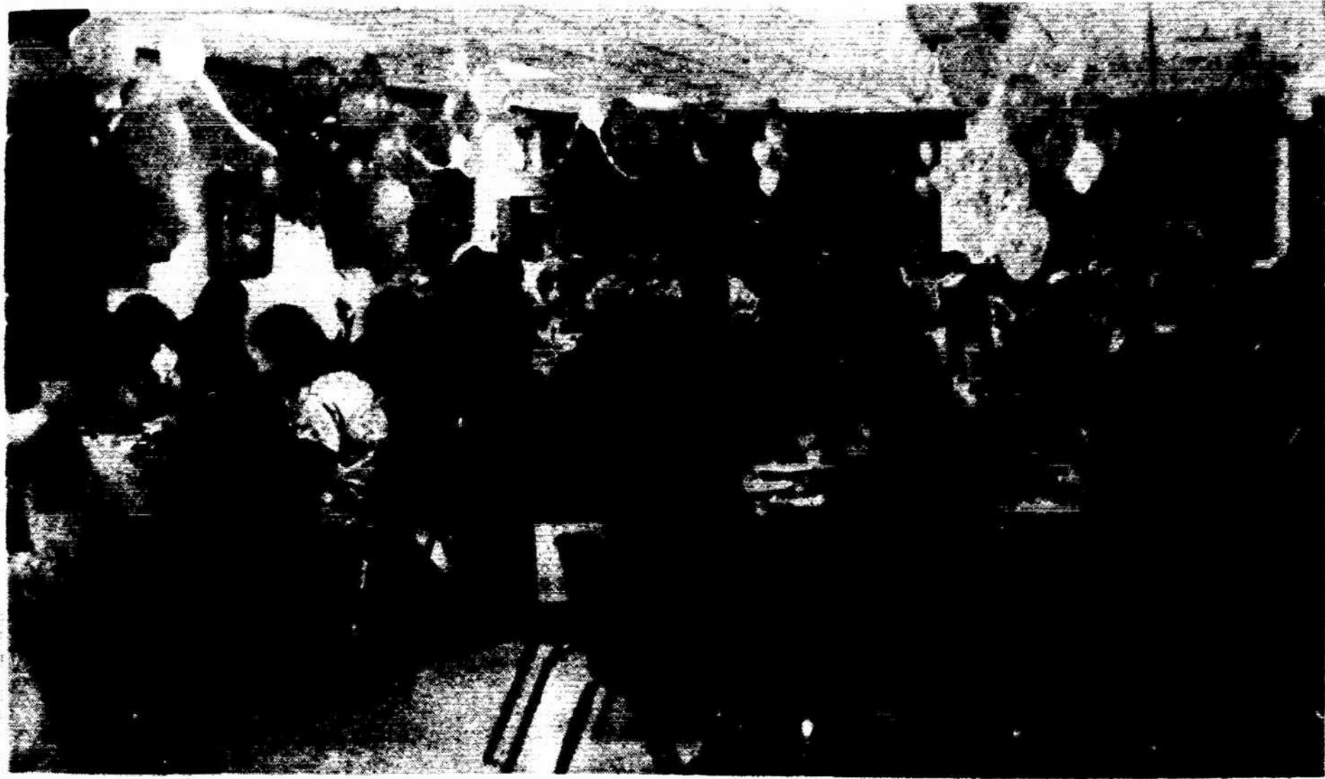
Maironio mokyklos dešimto skyriaus išleistuvių balius. Mokytojai, mokiniai, tėvai ir garbės stalias.