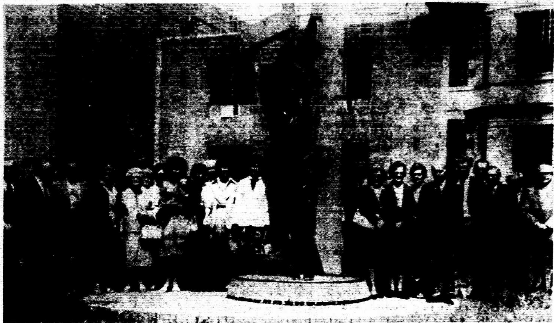
New Yorko ramovėnai gegužės 26 surengė kapų lankymą. Pranciškonų vienuolyno koplyčioje buvo mišios. Prieš eidami į kapines, visi nusifotografavo prie Laisvės paminklo priešais vienuolyną.