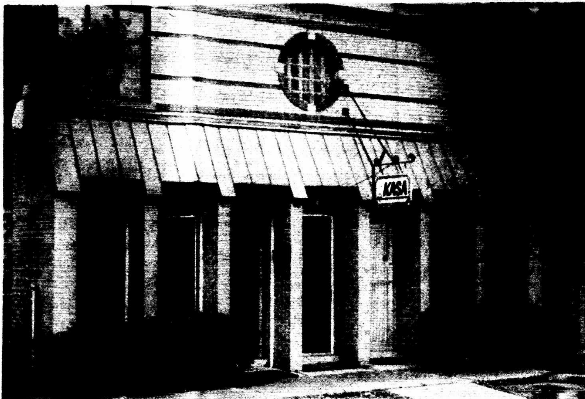
Nuosavi KASOS namai 2615 W. 71 Street, Marquette Park, Chicagoje.

Jai akomponavo William Smiddy. Po dainavimo jis dar solo paskambino Chopino poloneza.