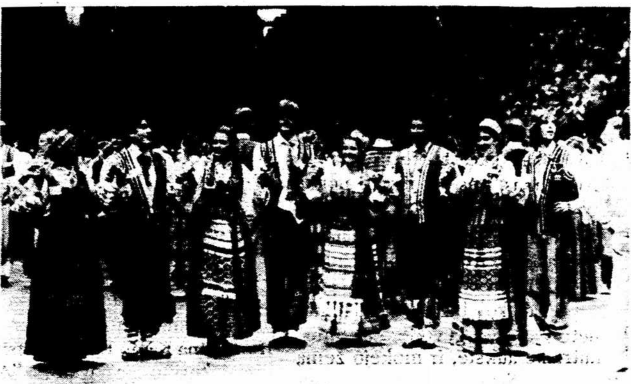
Argentinos tautinių šokių grupė Inkaras, dalyvavusi 7-oje tautinių šokių šventėje Clevelande.