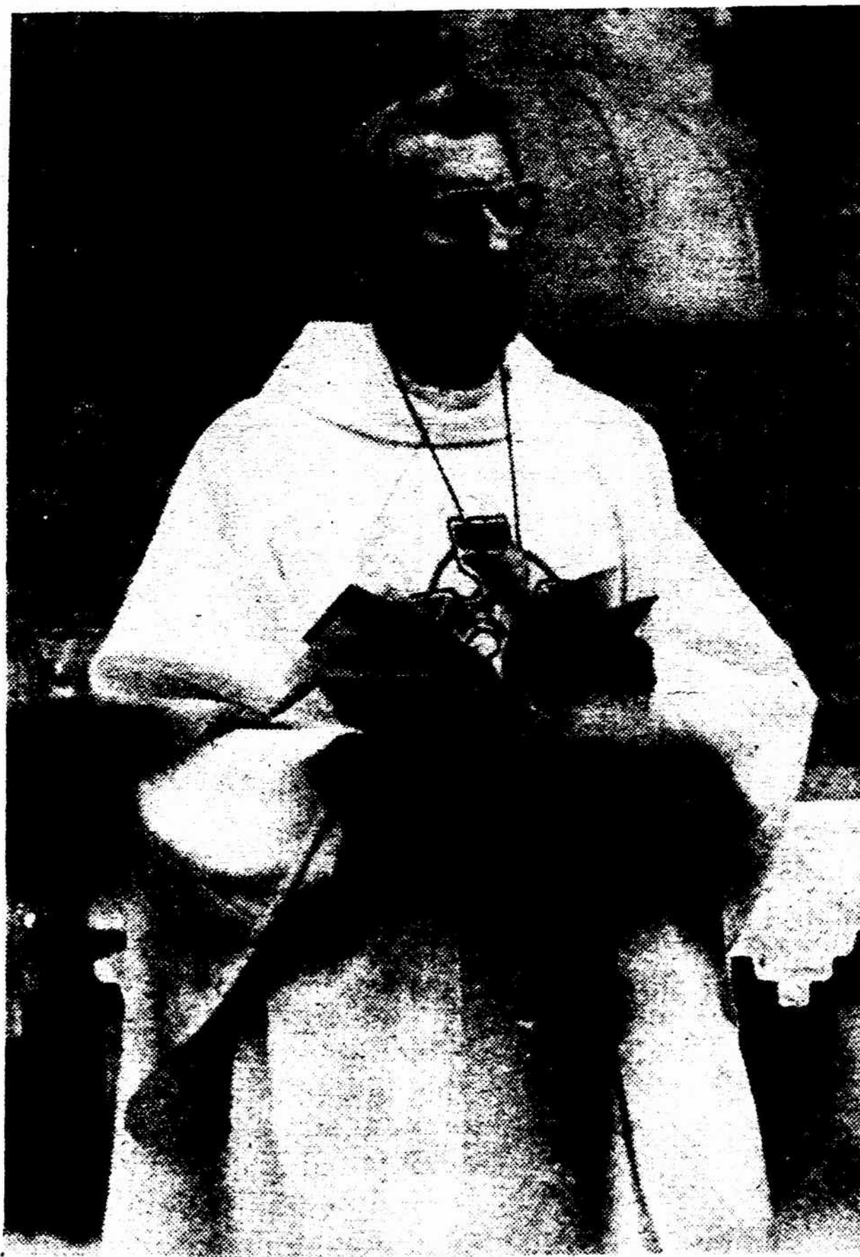
New Yorko arkivyskupas John O'Connor