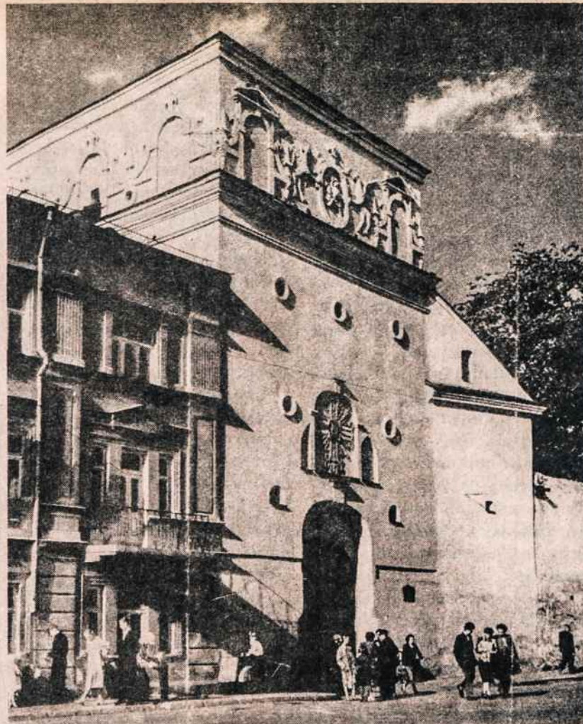
Aušros Vartai Vilniuje iš geležinkelio pusės.

Europos bendrosios rinkos valstybės nutarė nuo sausio 1 nutraukti Sov. S-gai nuo Lenkijos karo būklės įvedimo dienos taikytas ūkines sankcijas.