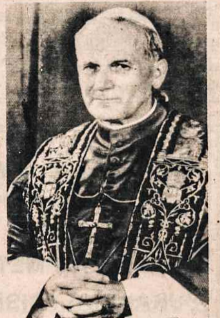
Popežius Jonas Paulius II: „Pusė mano širdies priklaus- so Lietuvai“

(naujai užsirašę gali skambinti "collect")