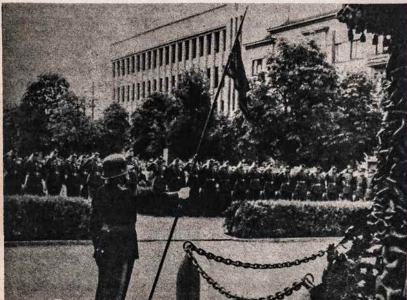
Nepriklausomybės laikais Lietuvos nepriklausomybės šventės metu prie Karo Muziejaus vykdavo gražios iškilmės. Nuotraukoje matome karo invalidų orkestro vėliavėlę ir išsiriškiavusius Karo Mokyklos dalinius.