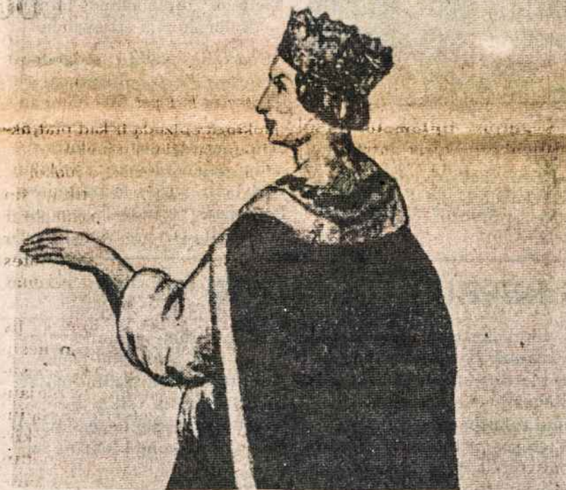
Karalienė Elzbieta, šv. Kazimiero motina, pagal gobeleną esantį Muencheno muziejuje, Vokietijoje.

Konferencija Švedijoje. Kad būtų suderinti visų lietuvių siekimai ir veikla, 1917 spalio 18-22 Stockholme, Švedijoje, buvo sušaukta konferencija. Čia susirinko lietuvių iš visų kraštų, — iš Rusijos, iš pačios Lietuvos ir iš Amerikos.