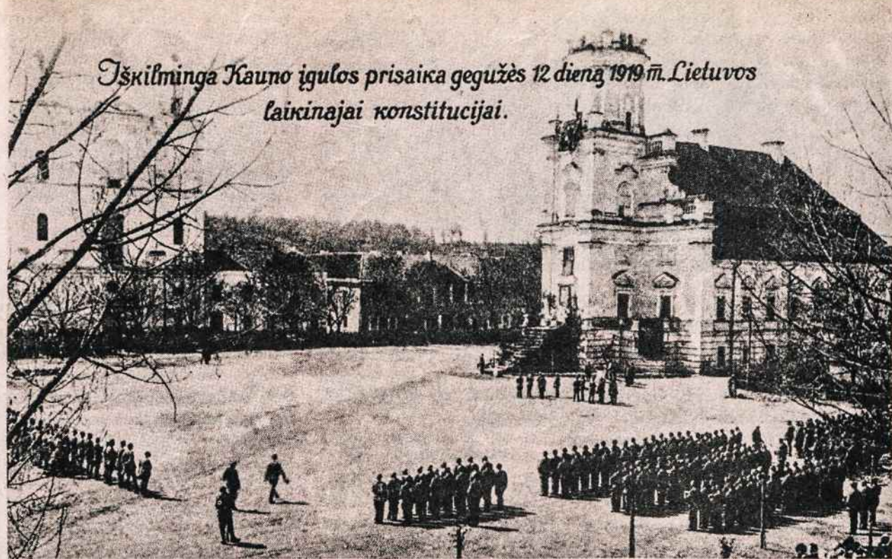
Kauno įgula 1919 gegužės 12 prisiekia laikinajai Lietuvos respublikos konstitucijai. Tai buvo pirmoji Lietuvos kariuomenės prisaiška. Gi laikinoji Lietuvos konstitucija buvo priimta Lietuvos Tarybos 1919 balandžio mėnesį. Taryba, pasirašiusi Lietuvos atstatymo nepriklausomybės aktą, vadinosi jau Lietuvos Valstybės taryba, ir ji veikė trejus metus, — nuo 1917, nuo Vilniaus konferencijos, iki 1920 steigiamojo seimo