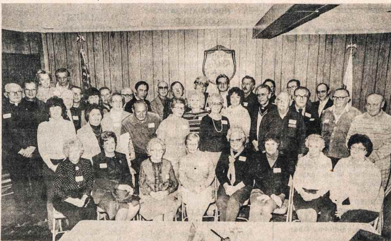
Šv. Kazimiero mirties 500 metų sukakties minėjimo Hartforde komitetas su talkininkais.