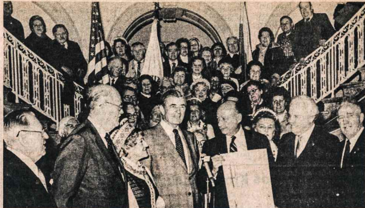
Vasario 16 New Yorko miesto valdybos rūmuose buvo paminėta Lietuvos nepriklausomybės šventė. Burmistras Koch lietuvių delegacijai įteikė proklamaciją. Į miesto valdybos rūmus buvo suvažiavę daug lietuvių, Maspetho Lietuvos vyčiai atvyko net specialiu autobusu.

Josvainiai, Kėdainių rajonas. 1983 birželio 28 - 29 Vioniaus