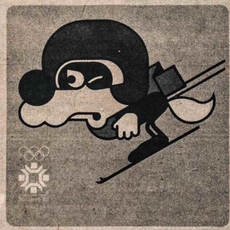
Sarajevo olimpinis talismanas Vučko

Olimpiniai žiemos žaidimai vyksta jau 60 metų. 1924 Chamonix, Prancūzijoje, buvo surengtas tarptautinis žiemos sporto spektaklis, kurį po vienerių metų Tarptautinis olimpinis komitetas pripažino pirmaisiais olimpiniais žiemos žaidimais. Dalyvavo 16-kos valstybių sportininkai. Buvo ir latvis