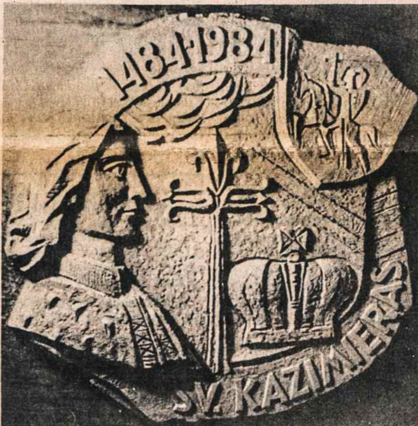
Šv. Kazimieras, skulptoriaus Aleksandro Marčiulionio specialus kūrinytis šiem jubiliejiniam šv. Kazimiero metams.

Besidžiaugdami tuo, neužmirškime ir savo vietovėse pagerbti šventąjį. Ir dar daugiau — įsigykime ir literatūros, ir šventojo paveikslų, ir medalį.