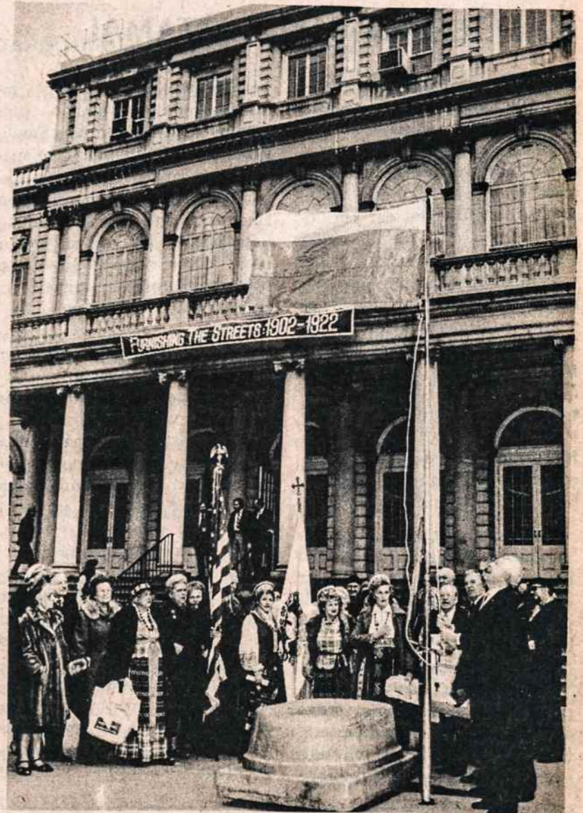
Prie New Yorko miesto valdybos rūmų - rotušės vasario 16 švenčiant Lietuvos nepriklausomybės šventę, pirmą kartą buvo iškelta ir Lietuvos vėliava. Lietuvos vyčiai stovi su savo organizacijos vėliava.

Painformuota apie operos pastatymą Torontė.