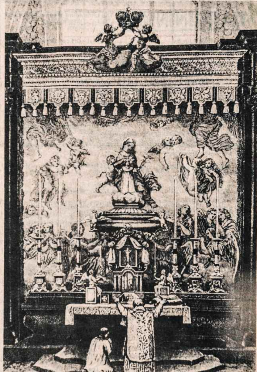
Šv. Kazimiero kopyčia 19 amžiaus pradžioje. Čia šv. Kazimiero karstas išbuvo per 300 metų. Kopyčią ir Vilniaus katedrą komunistai atėmė iš tikinčiųjų ir pavertė paveikslų galerija ir koncertų sale, gi šv. Kazimiero karstas 1953 gegužės mėn. buvo perkeltas į Šv. Petro ir Povilo bažnyčią Antakalny, Vilniaus priemiestį.

1953 metais komunistai iš tikinčiųjų atėmė Vilniaus katedrą ir ją pavertė paveikslų galerija ir koncertų sale. Atėmė ir šv. Kazimiero kopyčią. Šv. Kazimiero karstas tada buvo perkeltas į Šv. Petro ir Povilo bažnyčią Antakalnyje ir ten padėtas didžiajame altoriuje. (p.j.)