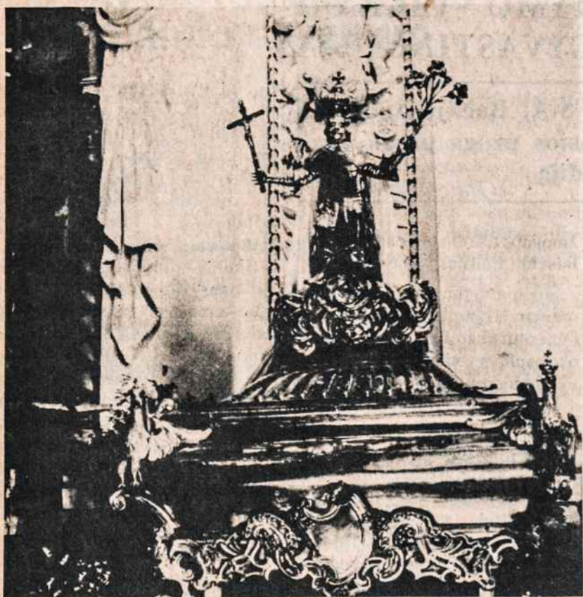
Taip dabar atrodo šv. Kazimiero karstas Šv. Petro ir Povilo bažnyčioje Antakalny.