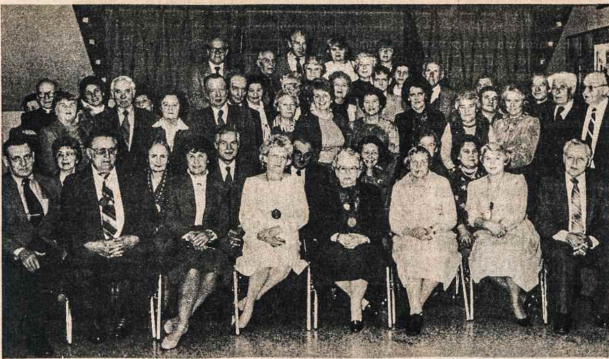
Ketvirtadienio ir penktadienio bingo grupių darbuotojai ir jų svečiai Kultūros Židiny balandžio 14 įvykusiame pobūvyje. Bingo darbuotojų grupės jau 14 metų dirba pranciškonų ir Kultūros Židinio labui.