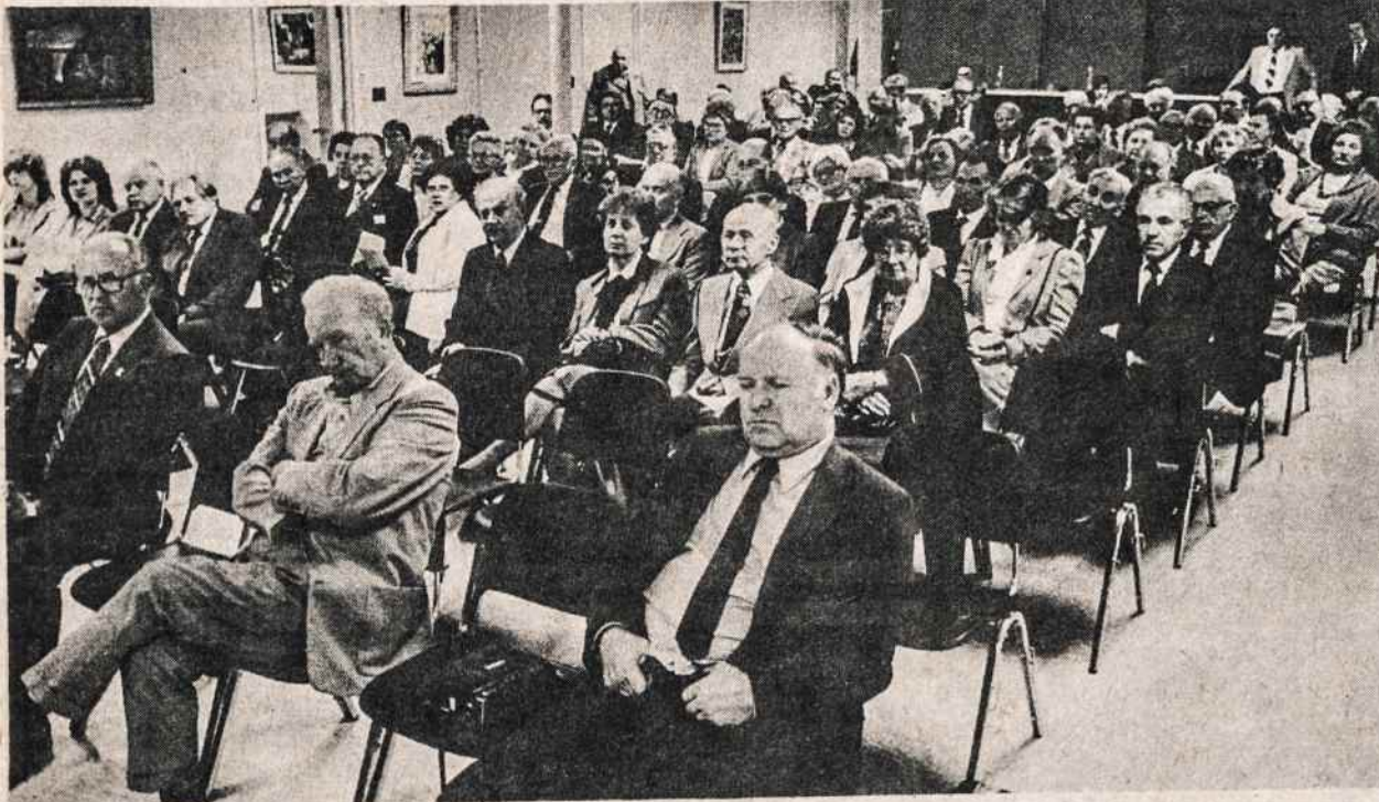
Kasos kredito unijos nariai balandžio 29 savo susirinkime Kultūros Židinyje.