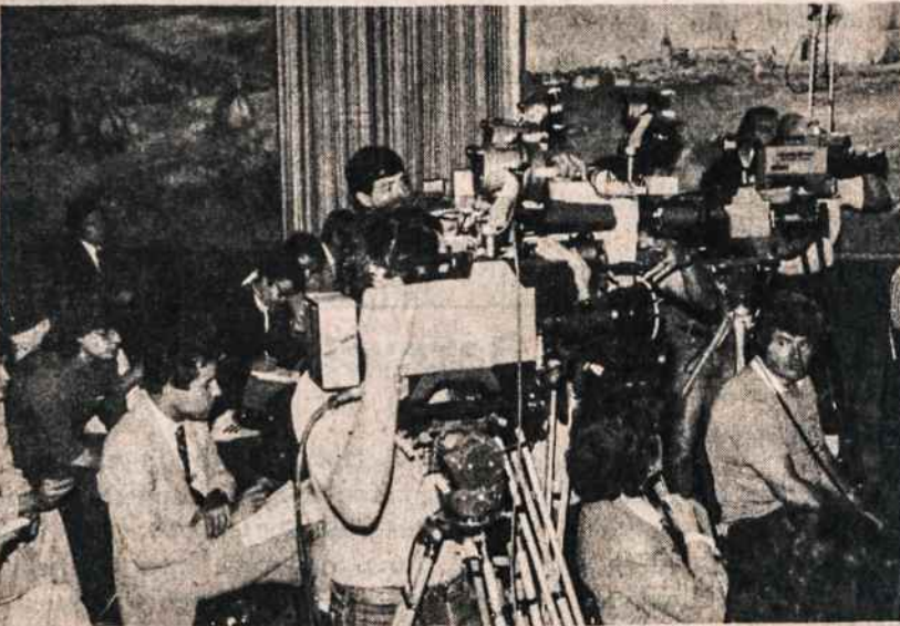
Televizijos korespondentai filmuoja Baltų Laisvės Lygos ir BAN konferenciją.