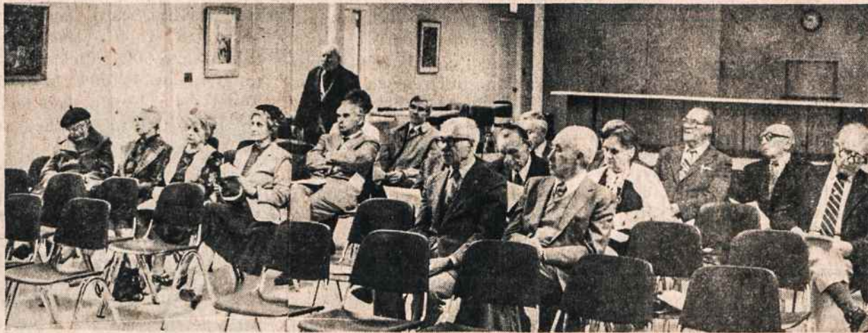
LB New Yorko apygardos suvažiavimo dalyviai. Suvažiavimas buvo balandžio 14 Kultūros Židinyje.