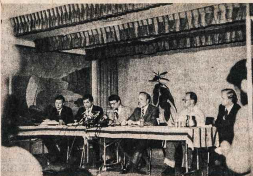
Baltų Laisvės Lygos ir BAN koalicijos kalbėtojai informuoja korespondentus. Antras iš kairės — Antanas Mažeika, antras iš dešinės — Simas Kudirka.