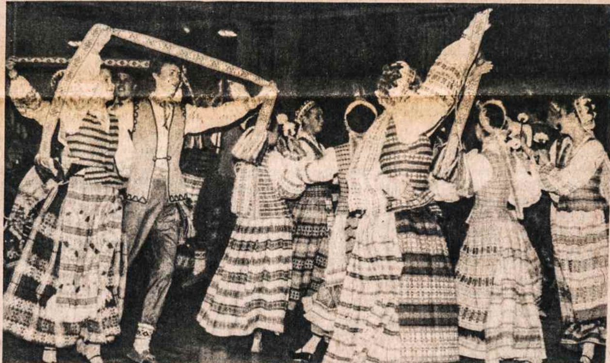
Grandinėlės metiniame baliuje gegužės 6, Clevelande.