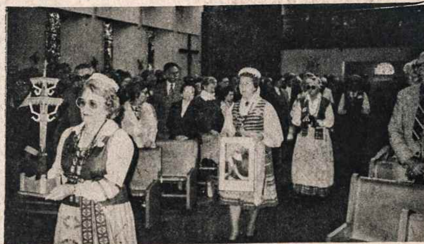
Lietuvos vyčių ekskursijai lankantis Toronte, 110 kuopos atstovės neša mišiu aukas Prisikėlimo parapijoje bažnyčioje.

Šių metų liepos 4 - 7 Etobicoke Olympium Centennial Park, Toronte įvyks Tarptautinė Laisvoji Olimpijada (Free Olympiad), kurią bendromis jėgomis rengia lietuviai, latviai, estai ir ukrainiečiai. Šiam reikalui yra sudarytas specialus komitetas iš