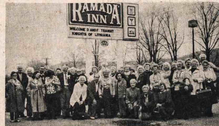
Lietuvos vyčių 110 kuopos ekskursijos dalyviai prie viešbučio. Jie trim autobusais važiuo iš New Yorko į Niagarą Falls, į Torontą, kur lankė įdomesnes vietas ir lietuviškas parapijas bei lietuviškas įstaigas.