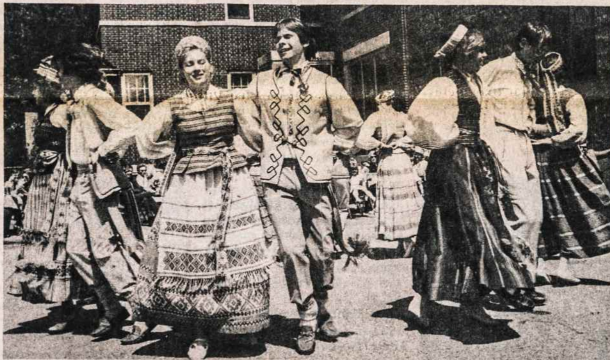
New Yorko Tryptinio jaunimas šoka tautinius šokius per Kultūros Židinio gegužinę Židinio kieme. Ansamblis taip pat dalyvaus ir tautinių šokių šventėje Clevelande.

Užaugo jaunoji karta, kuri jau nematė šio stebuklo. Reikia pagaminti vaizdajuostes ir parodyti jaunimo stovyklose, mokyklose. Ir jaunimas tegu pasisavina tas gražias maldas. Tegū būna sukaktis prisimenama ir kituose susirinkimuose.