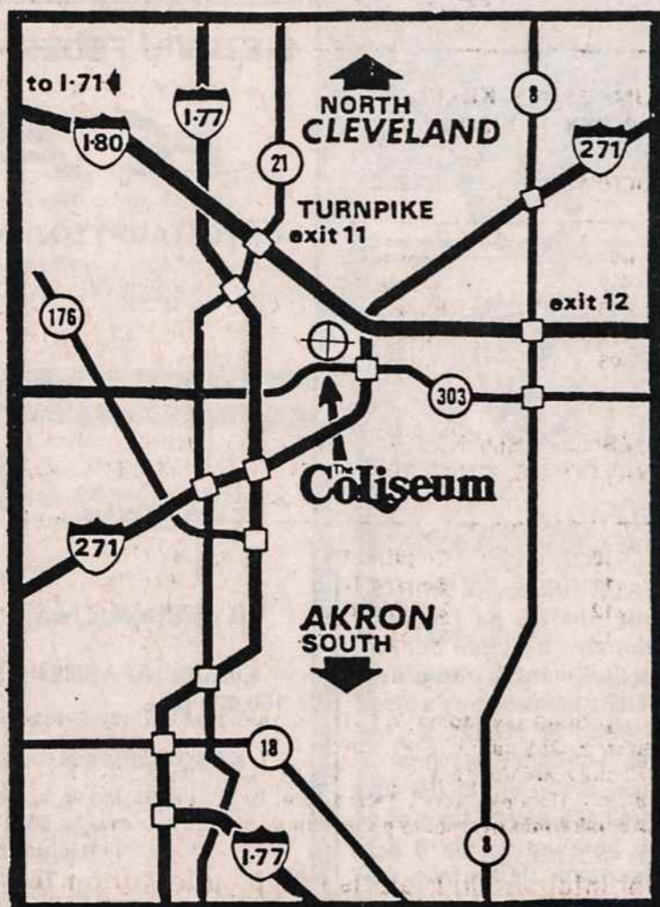
Planas, kaip nuvažiuoti į Koliziejų, kur bus 7-oji lietuvių tautinių šokių šventė. Prašom šį planą išsikirti ir pasiimti į kelionę.