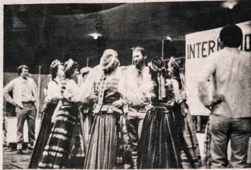
"Vėtros" veteranų tautinės grupės šokėjai Tarptautinio Studentų Centro mugėje New Havene balandžio 7.