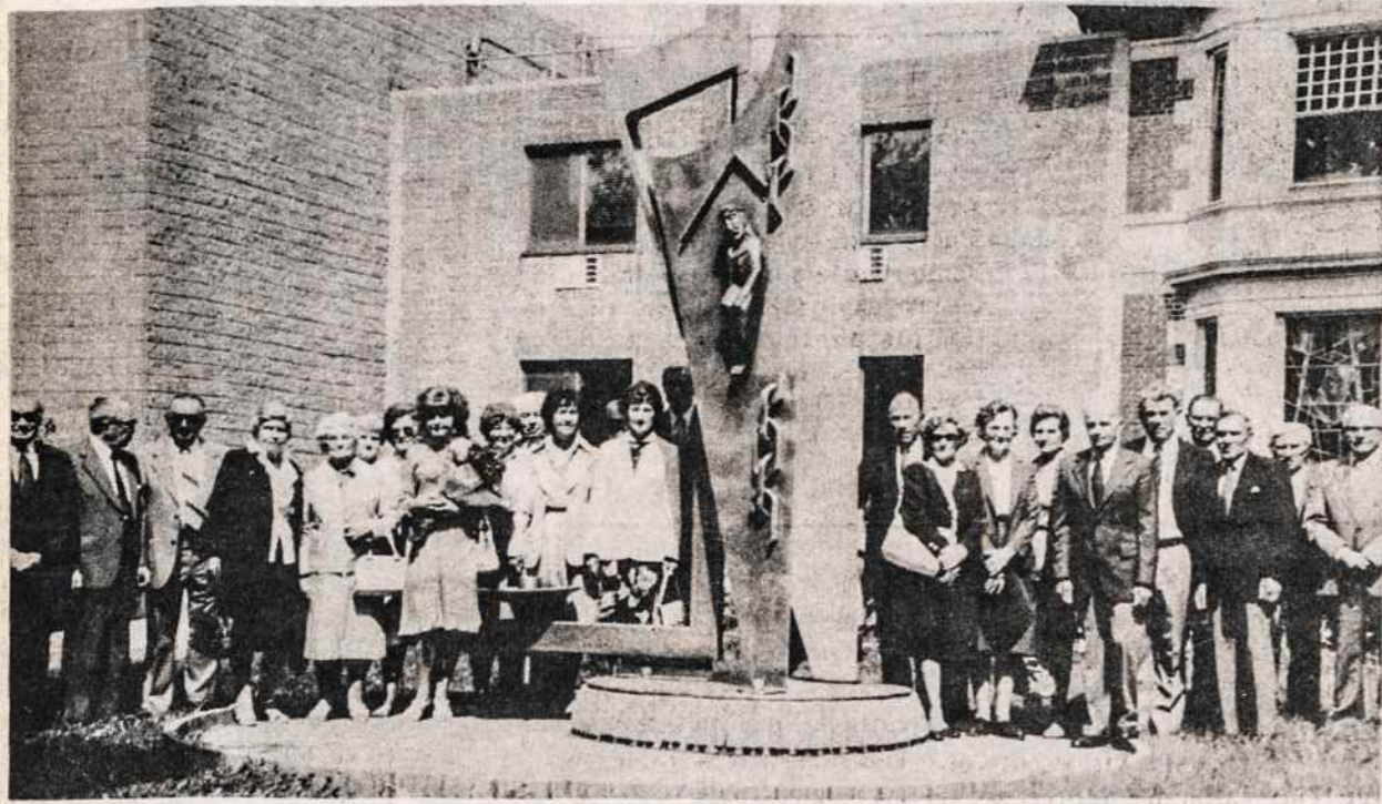
New Yorko ramovėnai gegužės 26 surengė kapų lankymą. Pranciškonų vienuolyno koplyčioje buvo mišios. Prieš eidami į kapines, visi nusifotografavo prie Laisvės paminklo priešais vienuolyną.