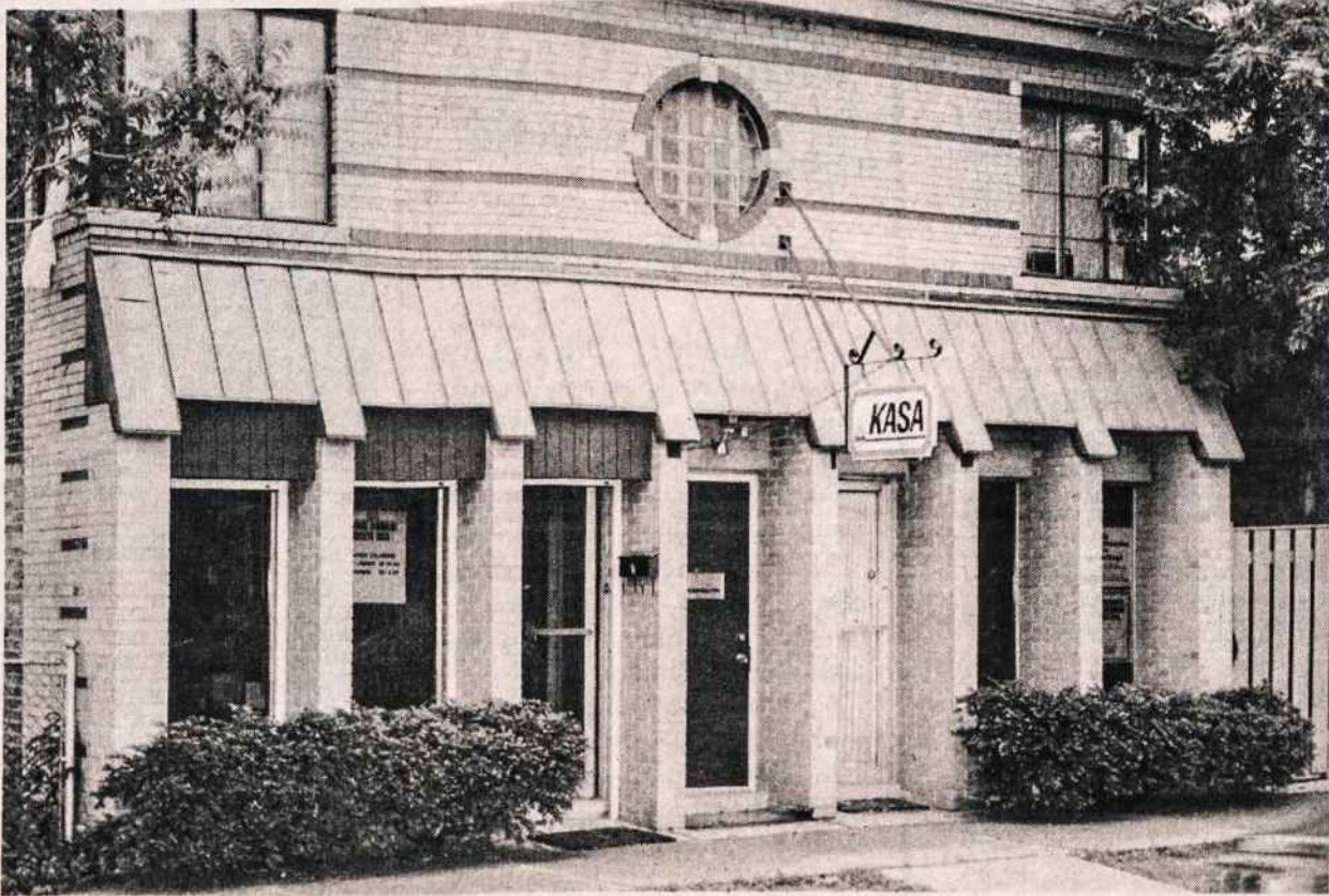
Nuosavi KASOS namai 2615 W. 71 Street, Marquette Park, Chicagoje.

Jai akomponavo William Smiddy. Po dainavimo jis dar solo paskambino Chopino poloneza.