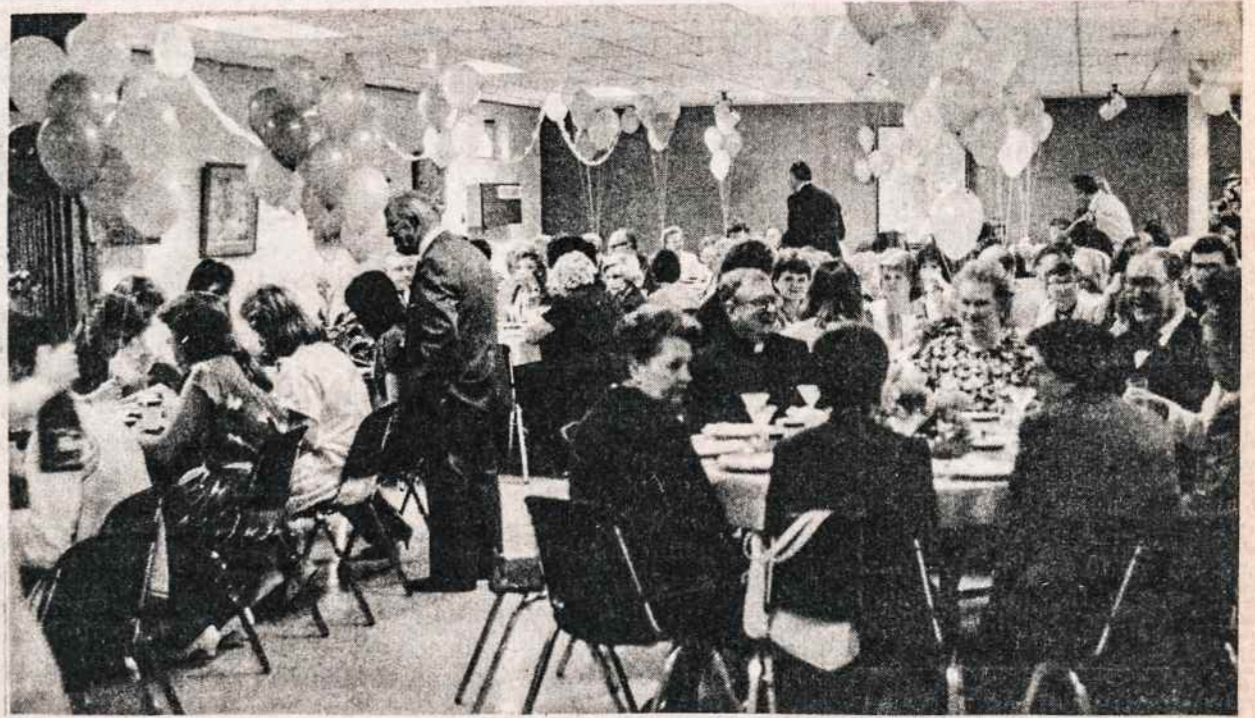
Maironio mokyklos dešimto skyriaus išleistuvių balius. Mokytojai, mokiniai, tėvai ir garbės stalas.

QUEENS COLLISION CENTER INC. Expert auto body works — Ducco painting — Welding — Frames straightened — Fiber glass work. John R. Chicavich, 131-13 Hillside Avenue, Richmond Hill, N.Y. 11418. 24 hr. towing phone HI 1-6666. Towing after 6:00—843-6677.