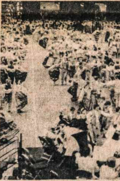
Septintosios tautinių šokių šventės vaizdas.

Linkime, kad ši garbinga ir graži organizacija stiprėtų ir didėtų!