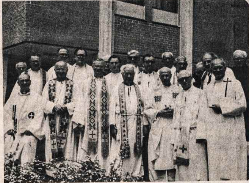
Lietuviai kunigai, dalyvavę kunigų rekolekcijose, kurios buvo birželio pradžioje seselių vienuolyne Putname, Conn.