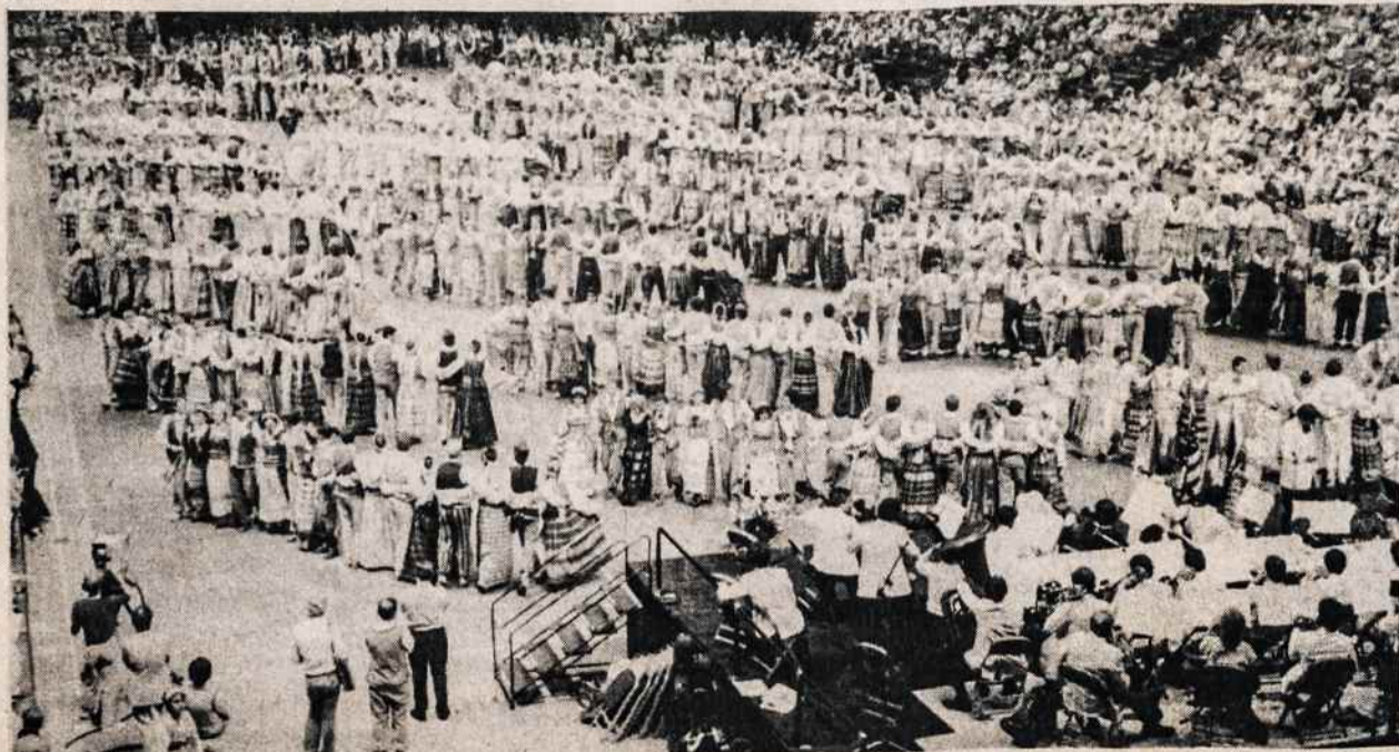
Iš 7-tos tautinių šokių šventės.

VYTIS INTERNATIONAL TRAVEL SERVICE 2129 KNAPP STREET BROOKLYN, N.Y. 11229 TEL.: (212) 769-3300