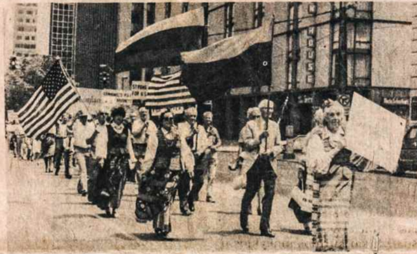
Clevelande liepos 21 įvyko Pavergtų tautų savaitės minėjimas. Parado metu miesto gatvėmis eina lietuvių grupė.

Iš kitos pusės, jei palikimo (Estate) interesus tokio greito pardavimo „nereikalauja“, o to reikalauja tik Tamstų brolis,