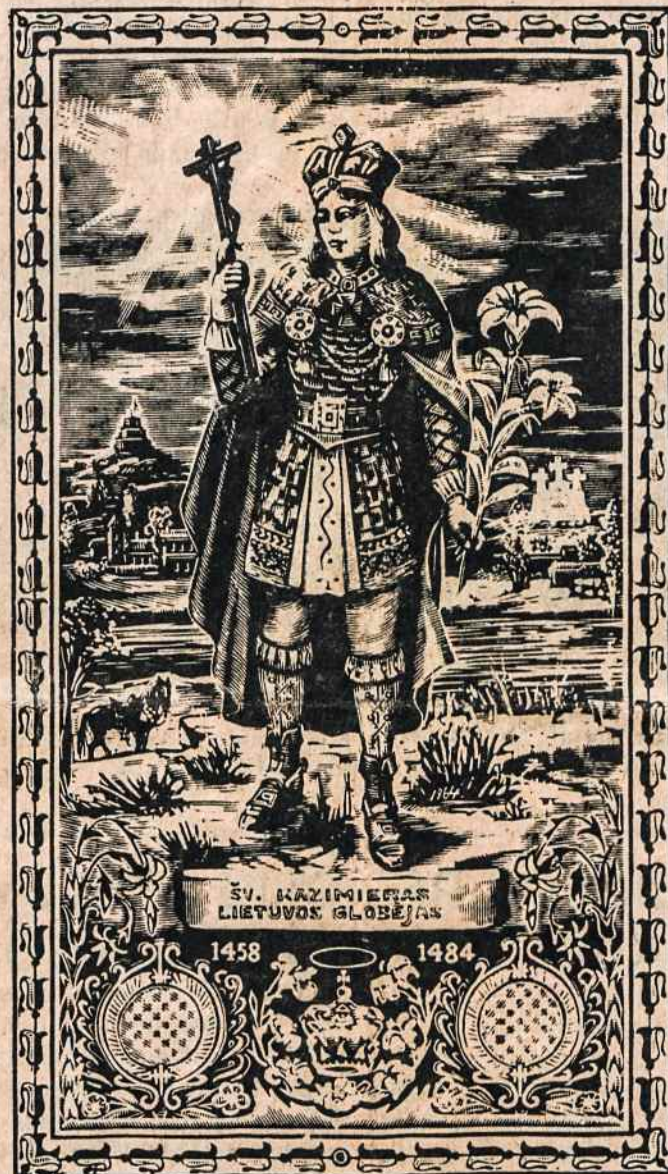
Šv. Kazimieras — Lietuvos globėjas. Medžio graviūra, sukurta dail. Jono Tričio 1964 metais.