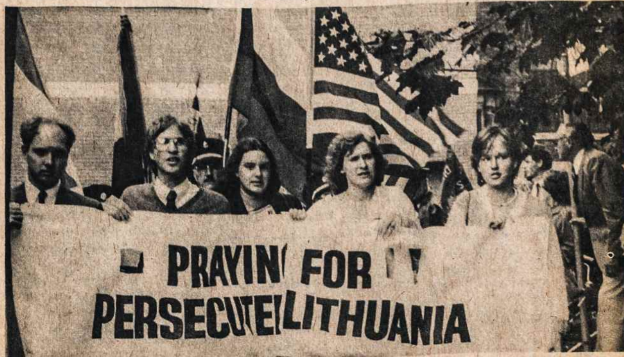
Lietuvių katalikų kongreso proga jaunimas demonstracijose žygiuoja iš Toronto rotušės į katedrą š.m. rugsėjo 2.