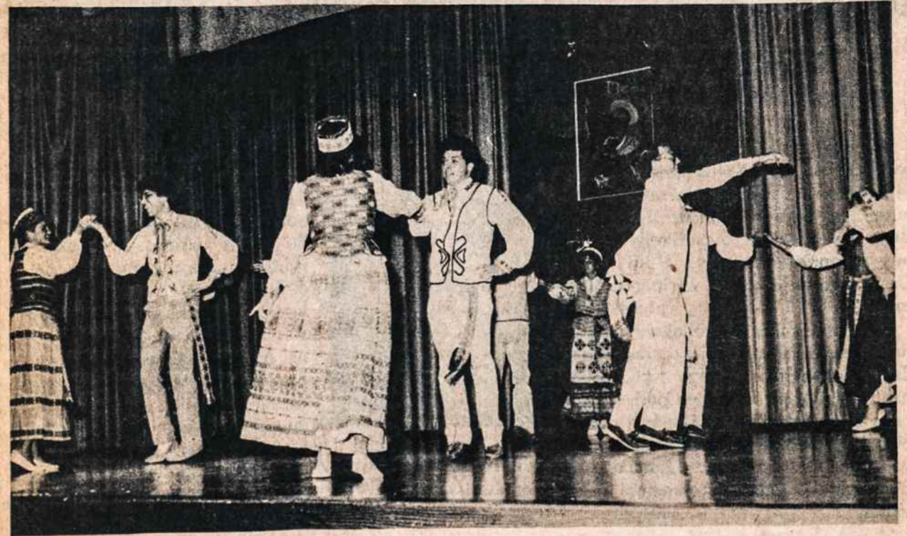
Tryptinio ansamblio veteranai šoka tautinius šokius rugsėjo 8 šv. Kazimiero jubiliejinėje šventėje Kultūros Židinyje.

ASSEMBLERS NIGHT/DAY SHIFT MEN/WOMEN BENEFITS 516 746-3736