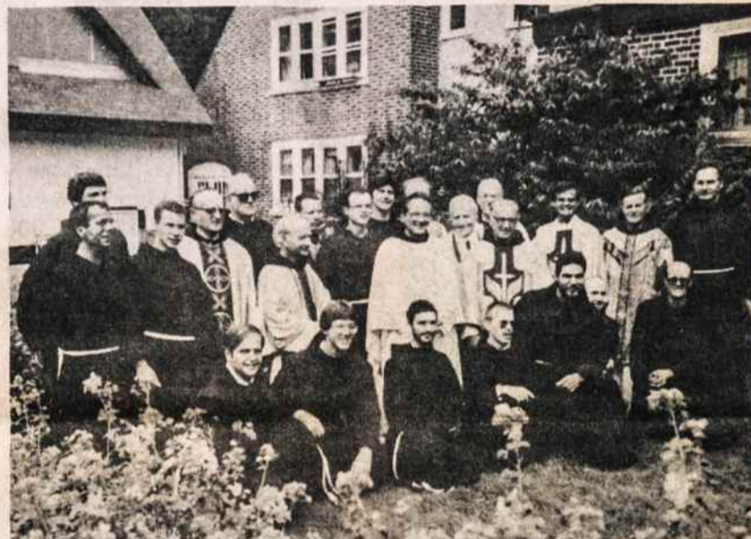
Po iškilmės visi dalyvavusieji apeigų mišiose vienuolyno kieme Kennebunkporte