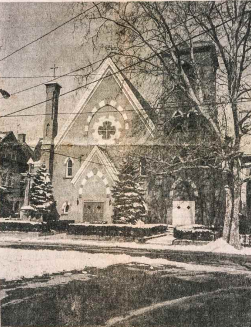
New Haven, Conn., lietuvių Šv. Kazimiero parapijos bažnyčia.