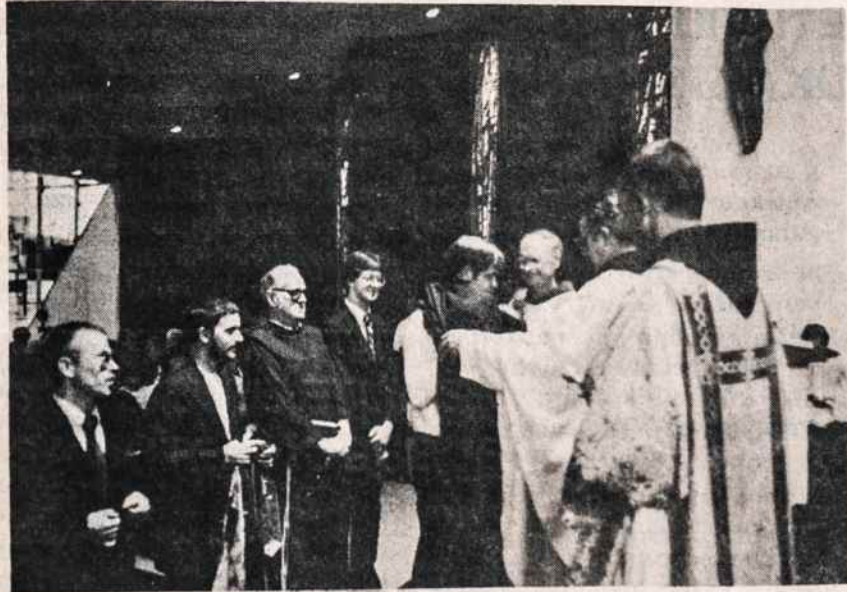
Įvilktuvų apeigos Kennebunkporte