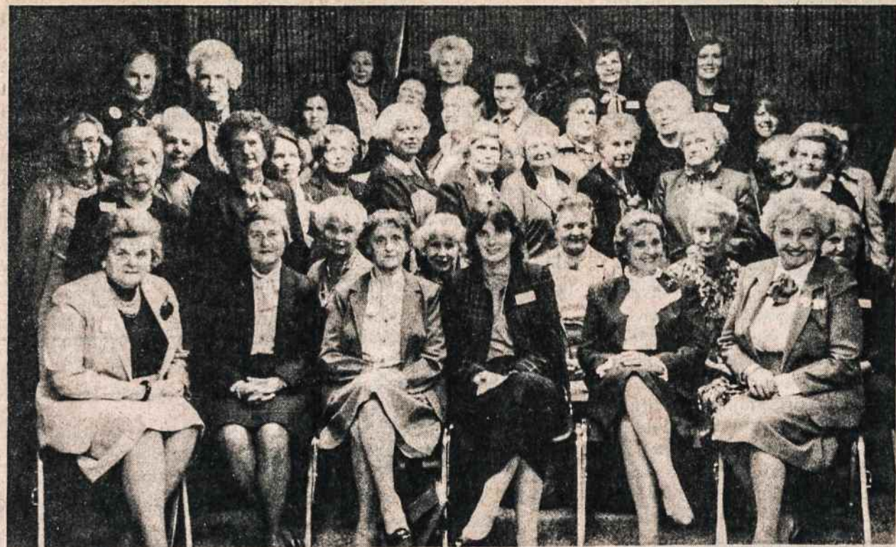
Lietuvių Moterų Klubų Federacijos suvažiavimo dalyvės. Suvažiavimas buvo spalio 27 Kultūros Židinyje.