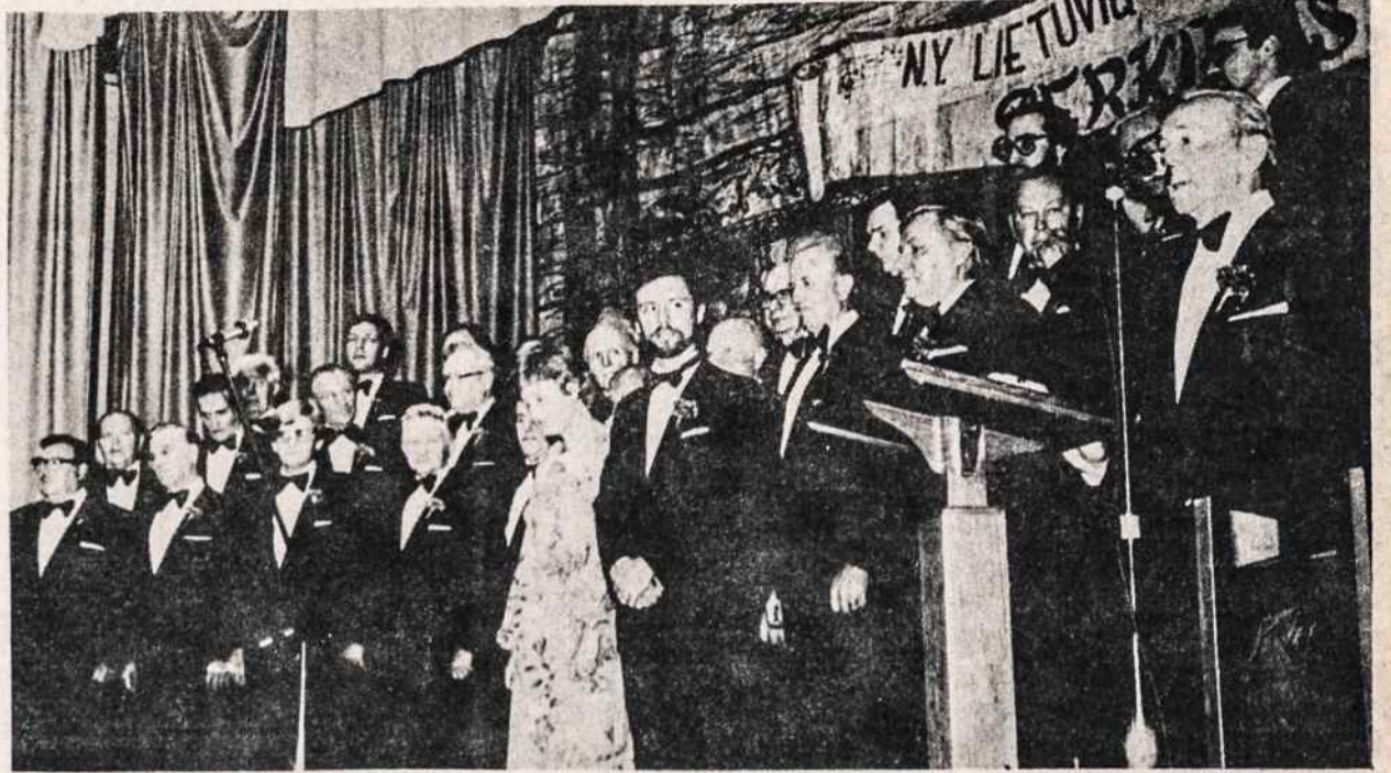
New Yorko lietuvių vyrų choras Perkūnas atliks programą Lietuvos kariuomenės šventės minėjime Bostone.

priėmė atlikėją ir nuoširdžiai jam dėkojo už suteiktą retą progą išgirsti vargonų muziką pilno recitalio pavidale. — J.K.