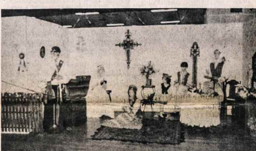
Tautodailės paroda Dayton, Ohio

Seniau Lietuva ir iš viso Baltijos kraštai buvo įtraukti į tam tikrą Finansų Ministerijos (Treasury Dept.) sąrašą kraštų, kuriuos nebuvo leidžiama siųsti federalinių pinigų. Taigi ir pensijos čekiai nebuvo ten siunčiami. Tačiau prieš maždaug 10 metų tas Finansų Ministerijos (Treasury Dept.) nusistatymas, dėl tik jiems vieniems suprantamų priežasčių, pasikeitė. Nors anksčiau jie buvo tos nuomonės, kad į Baltijos kraštus siunčiami čekiai negali būti "iškeisti už pilną vertę" (negotiated at full value), jie vėliau nutarė, kad tokio pavojaus nėra ir "išėmė" Baltijos kraštus iš to sąrašo. Taigi dabar, jei Tamsta nutartum išvažiuoti į okupuotą Lietuvą, gautum ten savo pensijos čekius. Pensijos gavimo atžvilgiu nėra jokio skirtumo tarp Amerikos piliiečio ir nepiliečio. Yra kai kurių užsiėmimų, kur reikalaujama Amerikos pilietybės. Tačiau esu tikra, kad Tamstos tai neliečia.