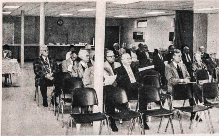
Dalis Kultūros Židinio narių metiniame suvažiavime spalio 13.

Besidžiaugiant šia Philadelphijos viešnage, reikia skatinti ir New Yorko jaunimą pasikelti į panašią veiklą. Kiek ten džiaugsmo ir prasmės surandama ir kiek daug gaunama ir duodama. Tegu atsiranda entuziastų ir New Yorke, kurie jaunimą suburtų panašiam darbui. Visi to laukia! (p.j.)