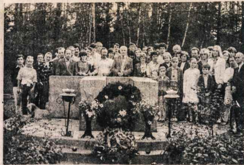
Iš Lenkijos lietuvių veiklos. Ščečino lietuviai prie Dariaus ir Girėno paminklo praeitais metais.