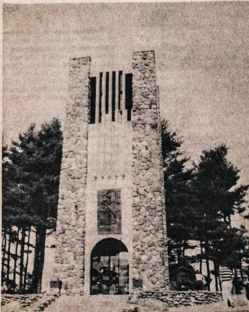
Varpų bokštas, įeinant į Pušų katedrą.

Tada jau kūrenosi didelis židinys, kad viduje būtų šilčiau. Ties židiniu vieta, skirta tam žuvusiam lakūnui. Čia kabo jo didelė fotografija ir pastatytas jo lėktuvo modelis. Toliau sienose prikabinta daugybė visokiausių nuotraukų iš Amerikos istorijos, iš šios katedros gyvenimo. Viršuje kabo vėliavos. Jos nuleistos žemėn. Tų vėliavų labai daug. Įvairiausių tautų. Rado me ir Lietuvos trispalvę.