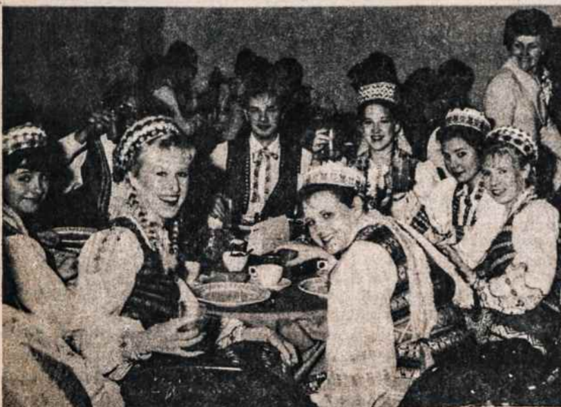
Grandies šokėjai po programos prie vaišių stalo.