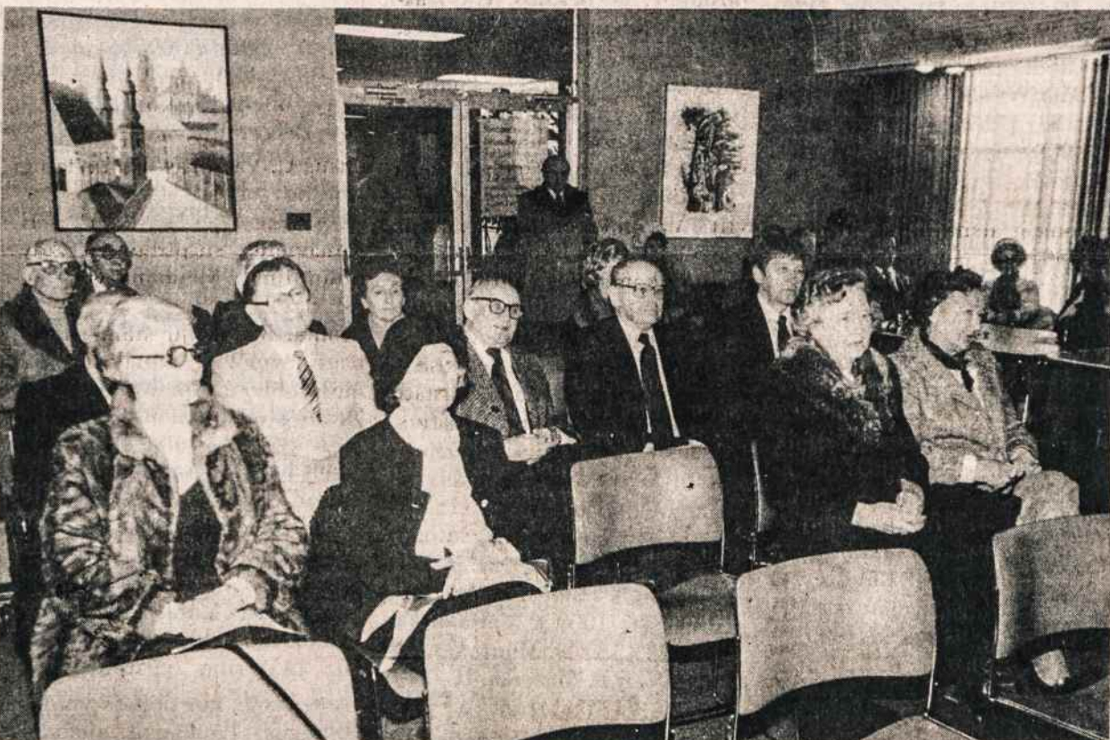
Iš Lietuvių Bendruomenės Detroito apylinkės valdybos suruoštos politinės popietės sausio 27. Matosi dalis popietės dalyvių.

Benamio likimas, priklausęs nuo Dievo valios ir didžiųjų, laisvų ir nelaisvų valstybių sprendimų, mus sujungė ir surišo į vieną stiprų vienetą, kuria-